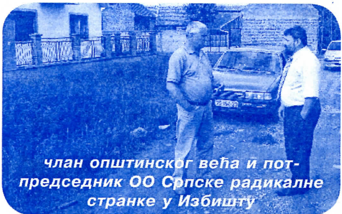
члан општинског већа и потпредседник ОО Српске радикалне странке у Избишту