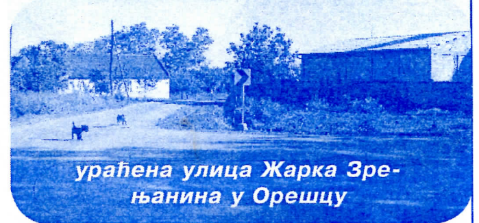
ураћена улица Жарка Зрењанина у Орешцу

У току су преговори са Телекомом да Загајица, Парта, Избиште, Потпорањ и