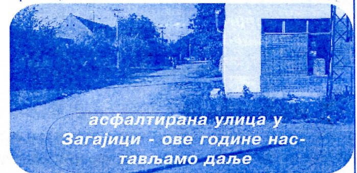
асфалтирана улица у Загајици - ове године настављамо даље

телекомуникација и у овом делу општине Вршац.