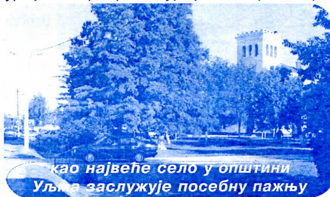
као највеће село у општини Уљма заслужује посебну пажњу

ли уличну расвету. Ове године биће комплетно реконструисан центар највећег села у општини. Уљма ће коначно добити изглед малог града, који заслужује, са лепим уређеним центром и уређеним паркинг про-