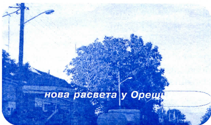
нова расвета у Орешцу