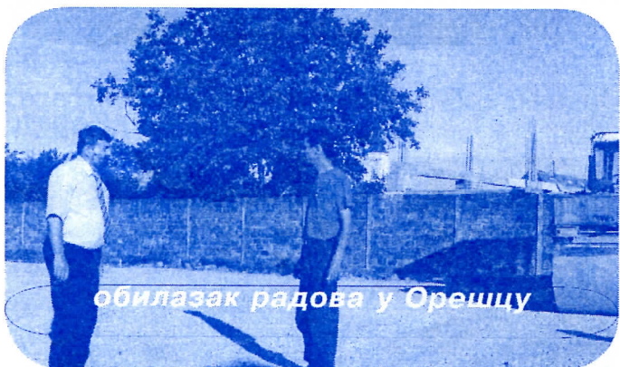
обилазак радова у Орешцу