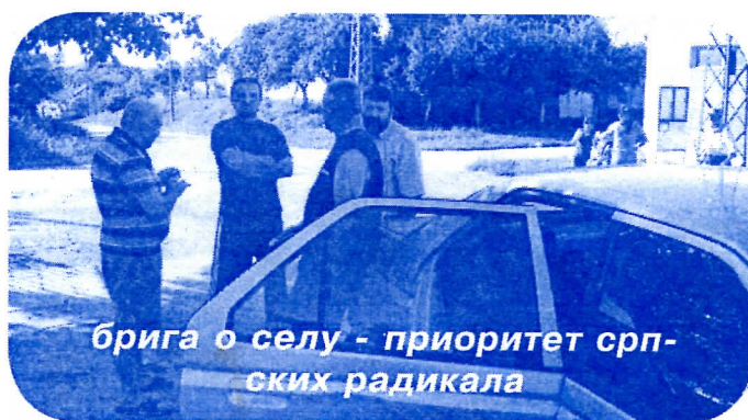
брига о селу - приоритет српских радикала