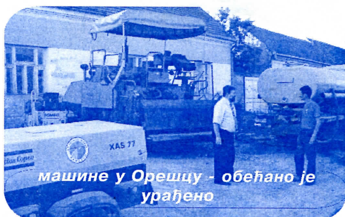
машине у Орешцу - обећано је урађено

И ове године са почетком сезоне почињу и радови на уређењу како градских, тако и сеоских улица и путева широм општине Вршац. Циљ нам је да комунална инфраструктура у свим насељеним местима у општини буде на завидном нивоу. Ово лето ће као и претходно бити обележено радовима, а планирамо да тако буде и следеће године, да се доведу у ред све улице по свим селима Општине, да пружимо свим нашим грађанима одређени стандард инфраструктуре, да сви имају квалитетне путеве, водоводну, електричну и телефонску мрежу, квалитетно улично осветљење и све остало неопходно да би се свака, било градска било сеоска средина даље развијала и у њој одвијао нормалан живот.