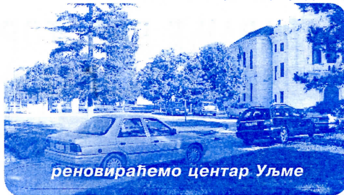
реновираћемо центар Уљме

ли уличну расвету. Ове године биће комплетно реконструисан центар највећег села у општини. Уљма ће коначно добити изглед малог града, који заслужује, са лепим уређеним центром и уређеним паркинг про-