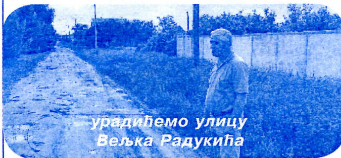
урадићемо улицу Вељка Радукића

изградња спортског терена. Завршено је и асфалтирање улица Жарка Зрењанина и ЈНА у овом насељеном месту, које до сада уопште нису имале асфалт.