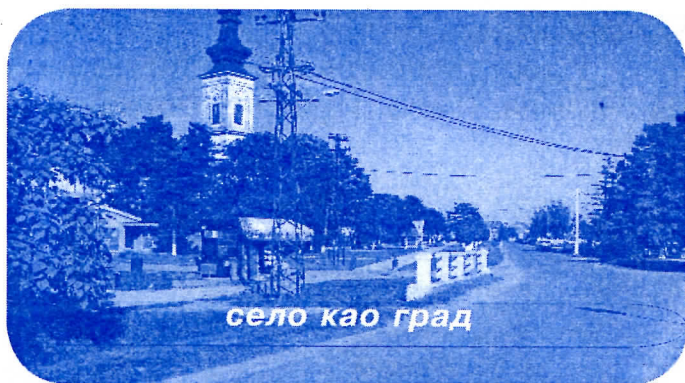
село као град