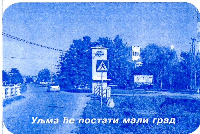
Уљма ће постати мали град

У неким селима је урађена улична расвета, асфалтирне су најпрометније улице.