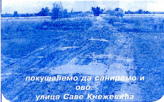
покушаћемо да санирамо и ово улица Саве Кнежевића

У Избишту ће овог лета бити асфалтиране улице Вељка Радукића и улица која води ка сеоском гробљу - Саве Кнежевића.