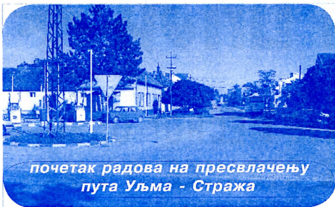
почетак радова на пресвлачењу пута Уљма - Стража

Протекла година била је, за разлику од претходних, година радова у свим селима Општине Вршац, па тако и у Уљми, Загајици, Парти и Орешцу. Коначно се кренуло са вртве тачке, локална самоуправа је почела да брине како за сам Вршац, тако и за околна насељена места. За разлику од периода 2000. - 2004. знатно је повећан како инвестициони део буџета општине, тако и део средстава намењеним инвестирању у селима Општине.