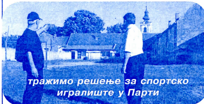
тражимо решење за спортско игралиште у Парти

У Парти је до сада реконструисана Белоцркванска улица, а у плану је да се