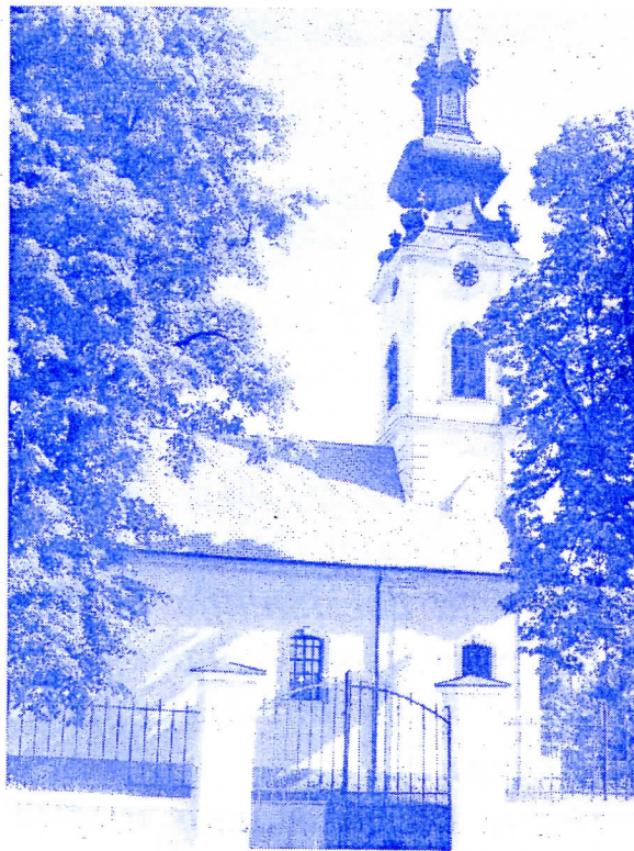
Српска Православна Црква

Заједно и даље желимо да будемо поштена и одговорна власт у општини