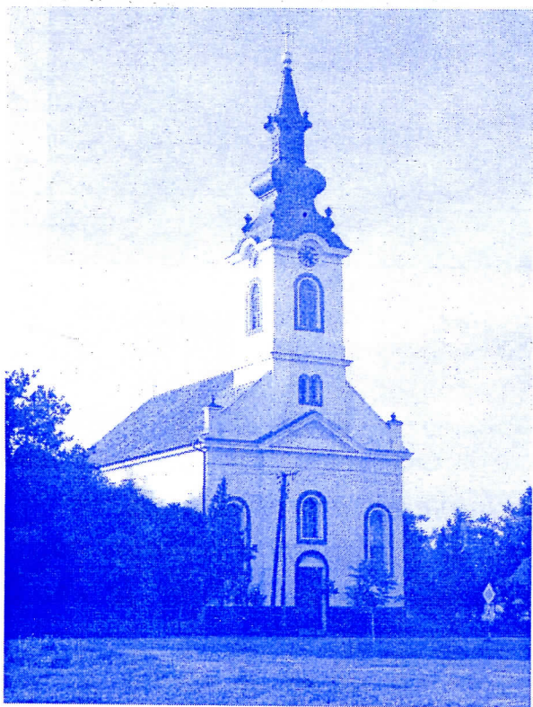
Словачка Евангелистичка Црква

У буџету општине на захтев Матице Словачке одређена су средства за њен рад, а општинска власт ове године помогла је адаптацију Евангелистичке цркве са 300.000,00 динара.