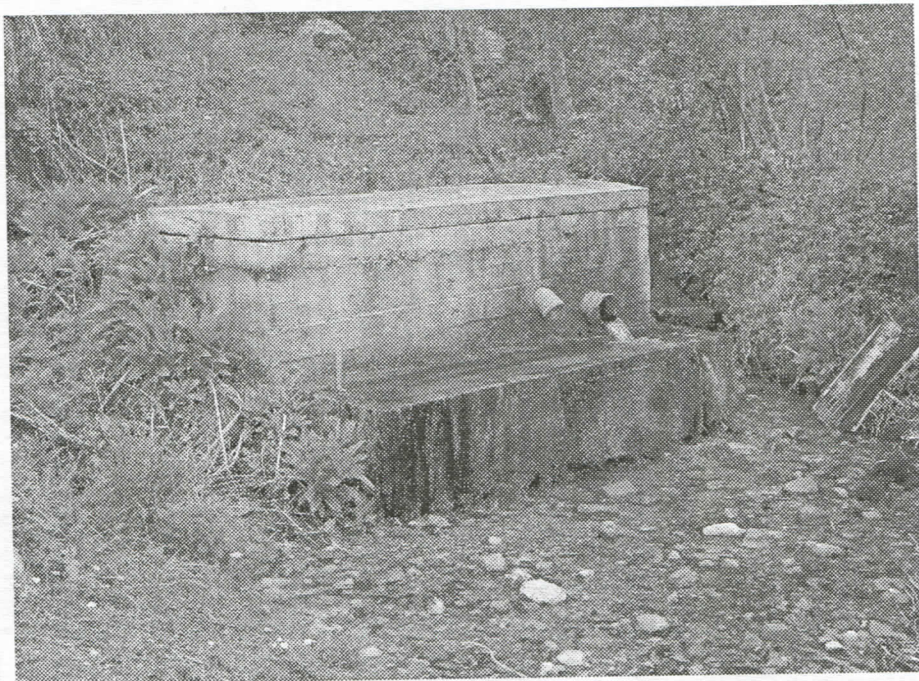
Пепељска бела вода

Проблем настаје када су се мештани Пепеља побунили плашећи се да ће остати без јединог извора у селу. Њихов страх подгревају и извештаји надлежних органа о значајном капацитету извора, који по њима нсу меродавни, јер, како кажу, мерења се увек врше у раном пролећном периоду када је доток воде највећи од снега са Поникава и обилних пролећних киша. Постојећи прелив у сушном периоду начисто пресахне а на њему се налази још 5 воденица поточара од преко 20 колико је некада било. Из разговора са њима сазнали