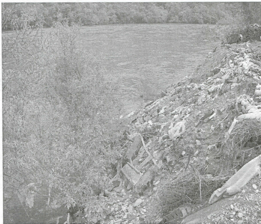
Депонија у Црвици ових дана

Скупштина општине Бајина Башта је на мартовској седници дала сагласност на Статут Јавног комуналног предузећа *Санитарна депонија Дубоко*, на реду је избор Управног одбора и других органа овог ЈП али све то прилично споро иде. У међувремену су се у овај пројекат поред општина ужичког округа укључиле и општине Чачак, Ивањица и Лучани што додатно компликује и успорава процес конституисања предузећа.