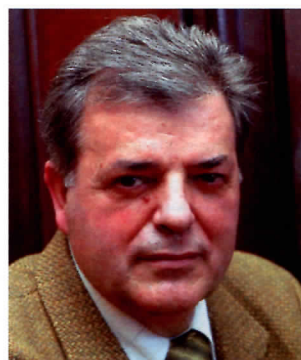
Сиромас сам - тим се дичим?