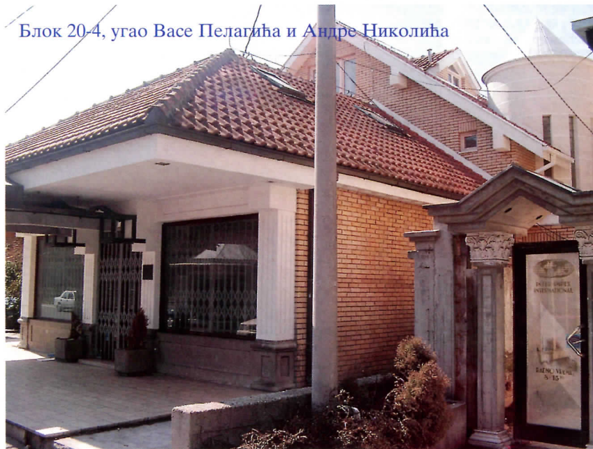
Блок 20-4, угао Васе Пелагића и Андре Николића