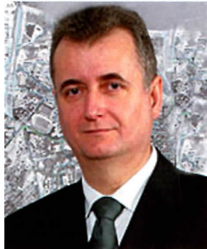
И земљи су тешки

То није све. Под теретом ове грађевине, почела је да се сабија и спушта земља, што је у околним кућама изазвало спољно и дубинско пуцање плафона и зидова. А прокопом канализације и водоводне мреже, из земље је почела да избија вода, па је у троуглу горе поменутих улица, на Топчидерском брду, изронило језеро. Вода је почела да надилази под темеље кућа, подижу се паркети у собама, са зидова цури влага, па кућа у Пушкиновој 28 а, данас подесећа на пловни објекат који израња из језера. Због прокопаног тла, рађених насипа око спорног објекта, појавило се све што је могло да изрони из земље, па пуногласници не избијају из