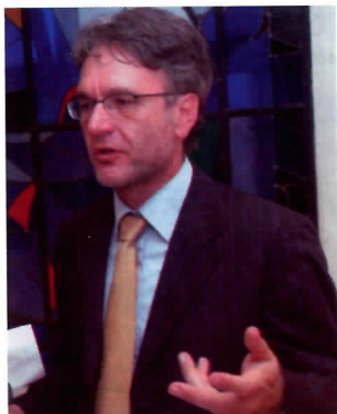
Грађани упозорили: Зар баш мора криминалац за председника Општине Савски венац

Тако је за ставку “планирање и пројектовање”, ребалансом буџета за ову годину планирано издвајање додатних 1, 8 милиона динара, тачније још 20.000 евра. Са оних 9 мил-