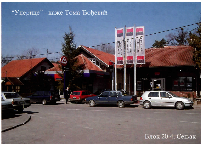
Блок 20-4, Сењак

Зна се иначе, да је Уставни суд прошле године интервенисао својом Одлуком, због начина на који се обавља легализација у Београду. Али суд није укинуо Закон о планирању и изградњи. Општинама није наложено да зауставе легализацију, већ напротив да