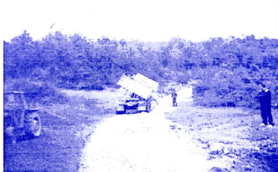
радови на путу Ђурђеви Ступови-Ботуровина

СРПСКА РАДИКАЛНА СТРАНКА ОО НОВИ ПАЗАР Ул. ШАБАНА КОЧЕ 18 Тел. 020 / 322 – 852 Радно време 10 – 16 часова