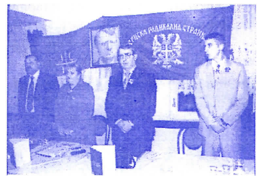
говориоци на промоцији књиге у Дежеви

Јавно је позвао васколико српство да се уједине у одбрани свих српских земаља и не дозволе да поново страдају од усташке каме као 1941-45, када је на стотине и стотине хиљада срба погубљено и бачено у јаме широм Баније, Кордуна, Лике, Далмације, Херцеговине а да не спомињем Јасеновац и многа друга српска стратишта. Позивам војску да се повуче на наше историјске границе Карлобаг, Огулин, Карловац, Вировитица чиме ћемо одбранили српске земље и направити Велику Србију. Од тада па до данашњег дана ја сам уз Војислава Шешеља који се својих ставова никада није одрекао, што је и потврдио у Хашком процесу, када је пркосно и гордо