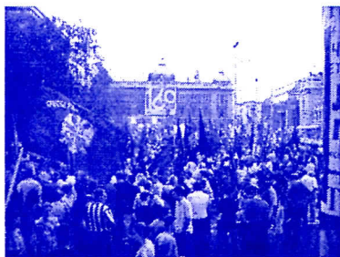
Митинг у Београду 24.02.2006.године

Општински одбор СРС Нови Пазар својим изјавама за јавност и обиласцима свог чланства