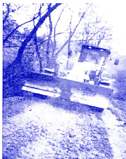
Радови на путу Шароње-Драмиће

СРПСКА РАДИКАЛНА СТРАНКА ОО НОВИ ПАЗАР Ул. ШАБАНА КОЧЕ 18 Тел. 020 / 322 – 852 Радно време 10 – 16 часова