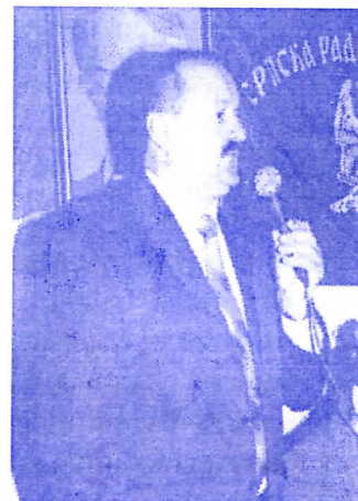
Председник ОО СРС

Успешно смо делили пропагандни материјал, обилазили месне одборе, држали трибине и водили разговоре са чланством, а наша снага на терену најбоље је показана приликом недавне промоције књиге др Војислава Шешеља „Сведочење у Хагу“, где је присуствовало више око 300 чланова и симпатизера.