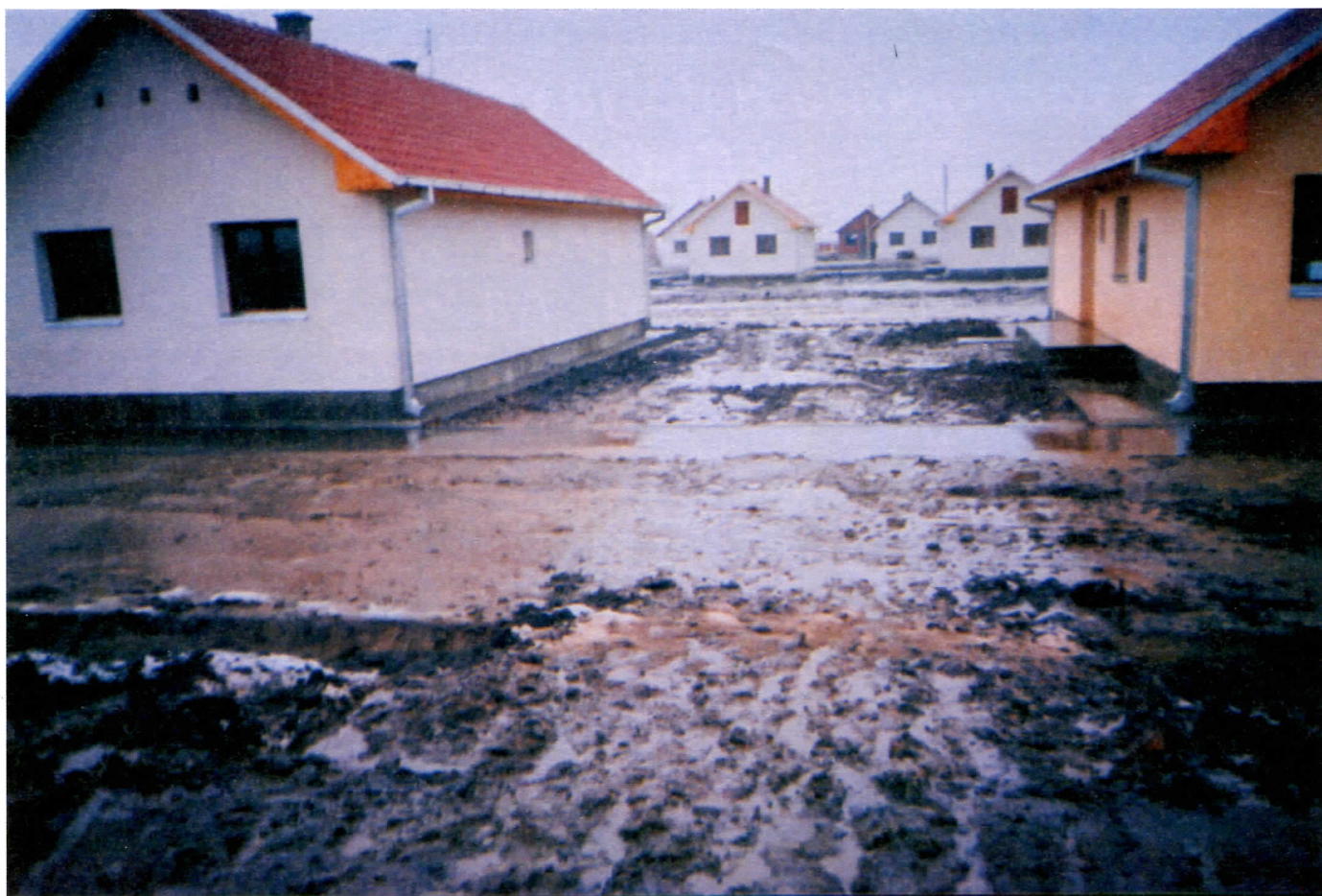
Насеље „ Утрина “ почетком фебруара 2006. године. Чему се надати у априлу?

Како данас, после милиона и милиона уложених динара у изградњу, изгледа Јаша Томић када падне киша, жалосно је. Чија кривица је већа државе или локалне власти што није урадила на време санацију обала и одбрамбених линија од поплава? Забрињавајуће чињенице су изнете на Скупштини општине у вези опасности од поплава. Једино што су се сложили сви одборници владајуће већине на Скупштини, јесте да се закаснило са санацијом обале Тамиша. Ко је крив за то? наравно није речено! Према речима одговорних и стручњака чекају нас још веће поплаве од прошлогодишњих. Питање је ко је и зашто градио куће а да није предвидео њихову заштиту од евентуалних поплава!