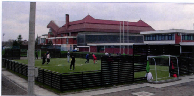
НОВИ МИНИ-ПИЧ ТЕРЕН