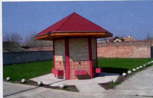
ЕКО ЧЕСМА У САВИНОМ СЕЛУ