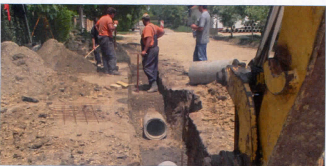
АТМОСФЕРСКА КАНАЛИЗАЦИЈА У КОСОВСКОЈ И ПРВОЈ НОВОЈ У ВРБАСУ