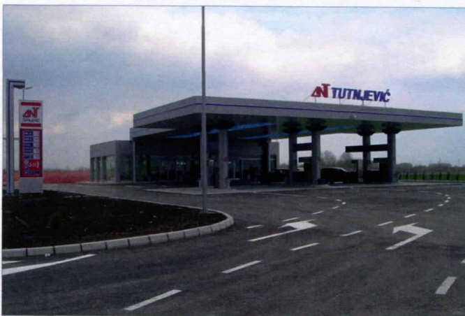
ИНВЕСТИЦИЈЕ УСЛОВ ЗА НОВА РАДНА МЕСТА