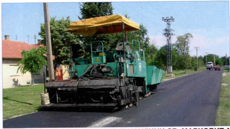
РАДОВИ НА ПУТУ У УЛИЦИ СВ. МАРКОВИЋА

Списак активности, наравно, није коначан.