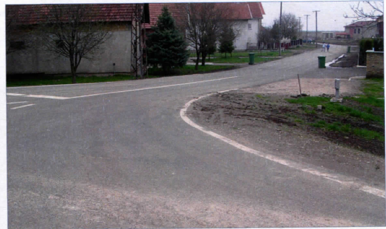
ПУТ У БЛОКУ 3 У ВРБАСУ