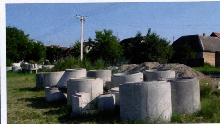
ИЗГРАДЊА КАНАЛИЗАЦИЈЕ У СТАРОМ ВРБАСУ