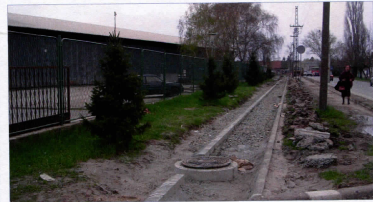
ИЗГРАДЊА КОЛЕКТОРА У ВРБАСУ