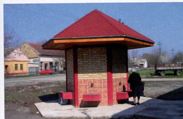
ЕКО ЧЕСМА У ЗМАЈЕВУ