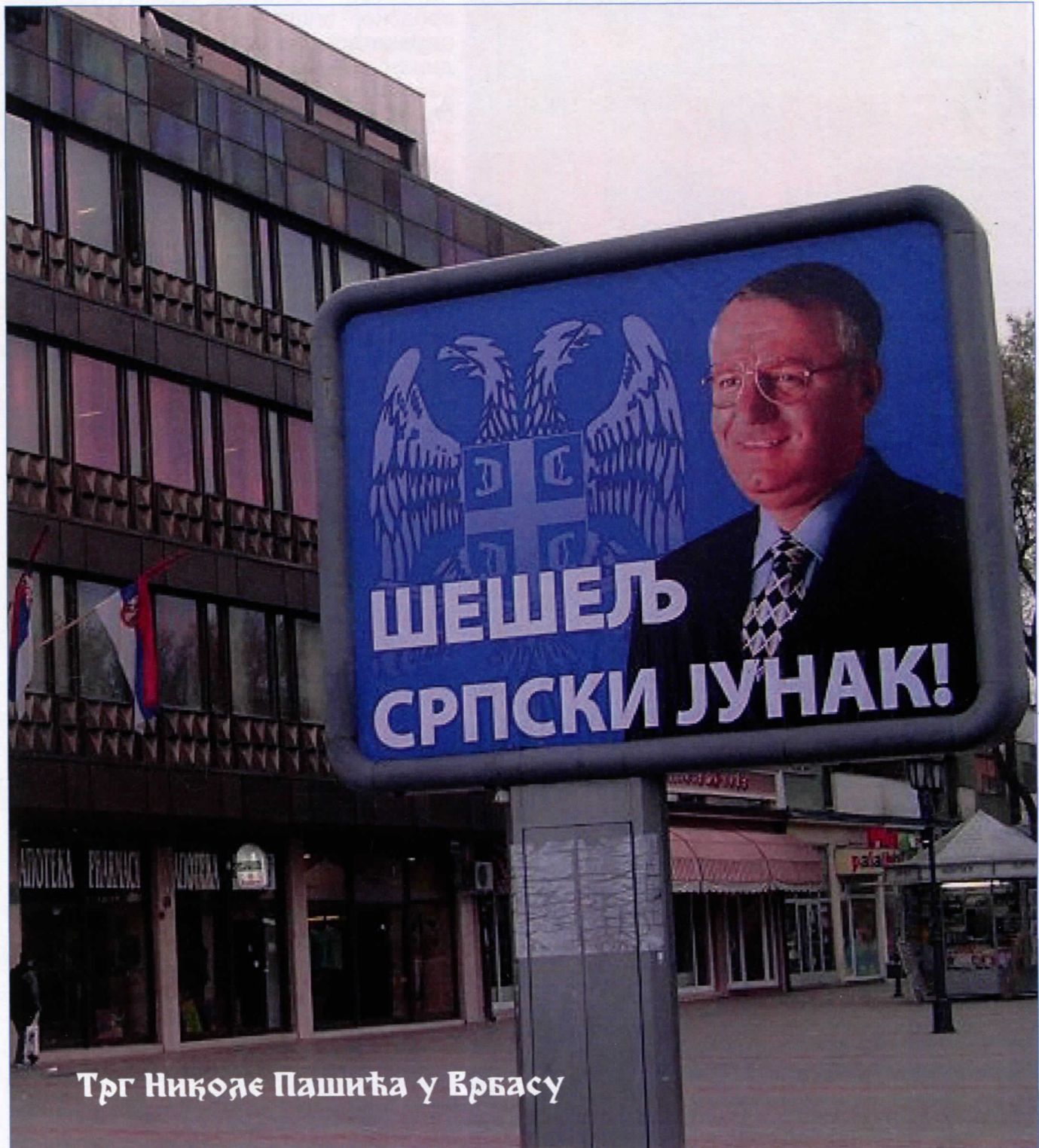
Трг Николе Пашића у Врбасу

ВРБАС, ЈУН 2006. ГОДИНЕ ГОДИНА XVII • БРОЈ 2457