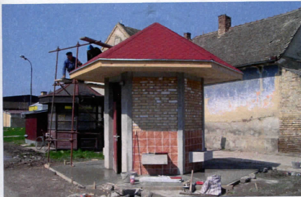
ЕКО ЧЕСМА У КУЦУРИ