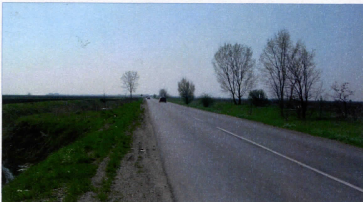
РЕКОНСТРУИСАН ПУТ БАЧКО ДОБРО ПОЉЕ-ЗМАЈЕВО,

Од последњег "рапорта" у специјалном издању ВЕЛИКЕ СРБИЈЕ, Српска радикална странка, као кључни чинилац локалне самоуправе у врбаској општини, своје активности одржавала је на нивоу почетне динамике и изузетног оптимизма. Уз сва објективна, али и наметнута ограничења, странка је као иницијатор и предводник у пословима важним за развој ове заједнице са несмањеним темпом радила на остваривању зацртаних планова.