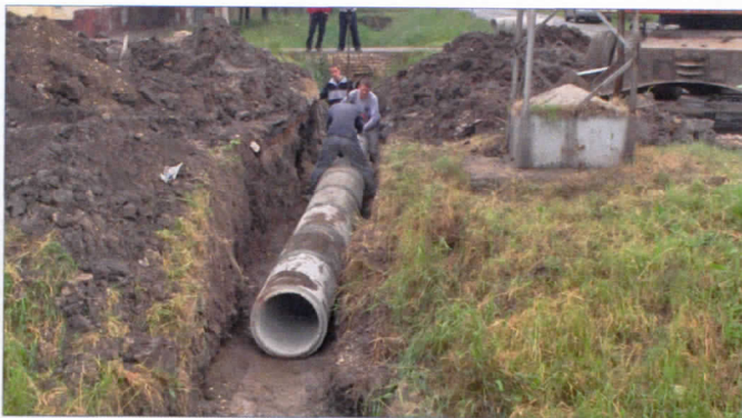
АТМОСФЕРСКЕ ВОДЕ У БАЧКОМ ДОБРОМ ПОЉУ ВИШЕ НЕ ПРЕДСТАВЊАЈУ ПРОБЛЕМ