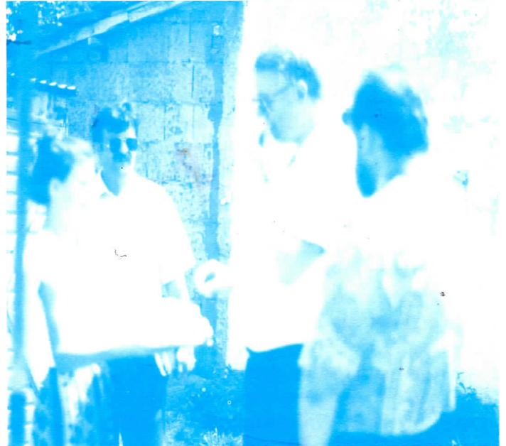
Др Војислав Шешељ у Срњу

Велико интересовање вла одлазак на митинг у Београд, 24-ог фебруара, посебно због тога, посебно због тога што је један од првих митинга СРС у нашем крају, одржан управо у Срњу, а на шта су Срњани посебно поносни.