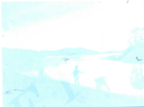
Расина није Дунав лучује општинским добрима.

Крушевачки водовод је, да подсетимо читаоце, подигнут средствима самогдоприноса и, иако формално није у својини општине, у суштини припада грађанима и не може им се опоришти право да одлучују о његовој судбини. Аргументно је и неувидљиво, али и иманентно неогосподарској владајућој коалицији, да бахато од-