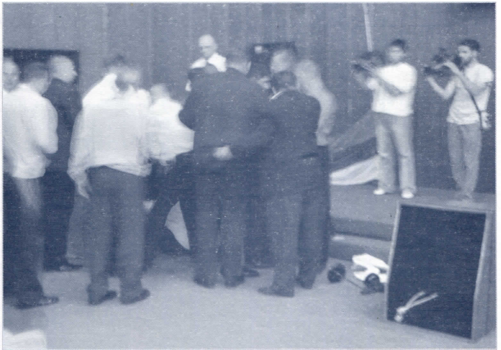
Примена силе према одборницима СРС 13.07.2005. године

У сфери криминала су и инвестиције које је садашња власт на велика звона објавила као своје велике успехе, као што је изградња "Макси дисконта", наставак изградње "Булевар" и крпљење рупа по саобраћајницама, јер "Макси дисконт" је изграђен без