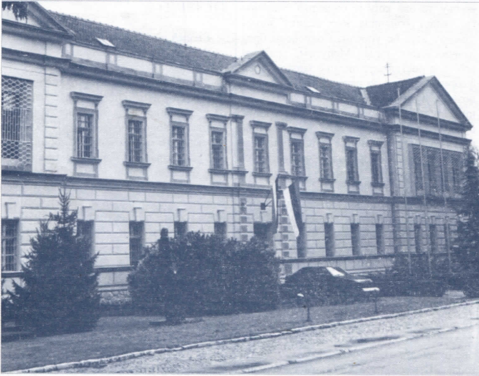
КПД: Неки су себи смештај већ обезбедили

Општинска власт предлаже да се укине родитељски додатак за прво дете у износу од 10 000 динара што је међу грађанима, нарочито младим брачним паровима, изазвало масовно огорчење и гнушање а њихов најчешћи коментар је: како их није срамота!!!