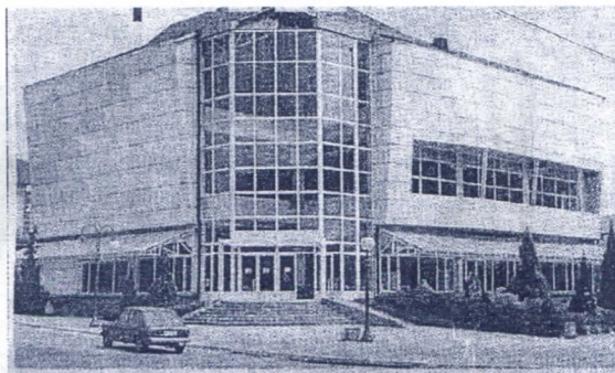
Камен сћипицања-робна кућа