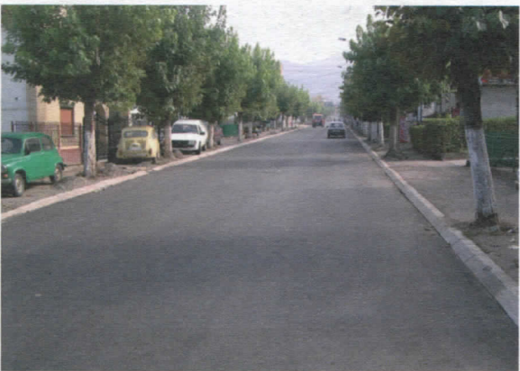
Магистрални пут М1/13; Ул. Југословенска, урађена средствима Дирекције за путеве Републике Србије