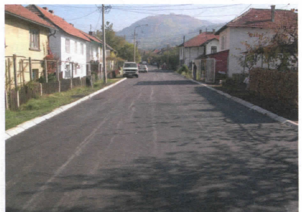
Ул. Томе Ивановића