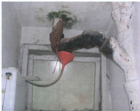
Ово смо затекли