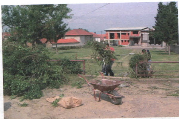
Сређивање парка у с. Масурица

Овде је само део активности ЈП „Водовод“. Подигли смо ниво комуналне хигијене у целој Општини, нарочито на Власини. Зимска служба је углавном одговорила својим обавезама. Стабилизovali смо водоснабдевање, и у тој области очекујемо нове инвестиције у 2006.год. Активности овог предузећа полако ћемо ширити на села, покушати да освежимо и обновимо возни парк, да увећамо број корисника услуга предузећа. Није још увек све на нивоу на којем желимо али верујемо да ћемо упорношћу и уз одговорност постићи све.