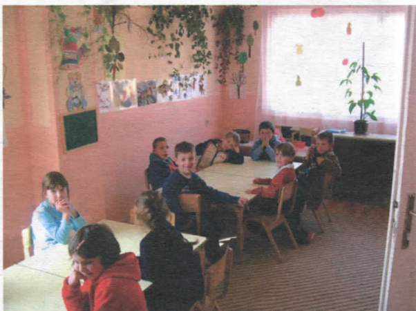
Обданиште у с. Алакинцу- унутрашњост