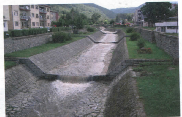
Кеј на реци Врли