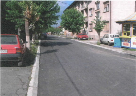
Ул. 5. септембар