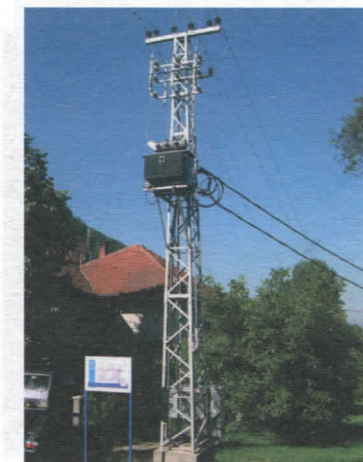
Стубна трафо- станица у Ђурковици