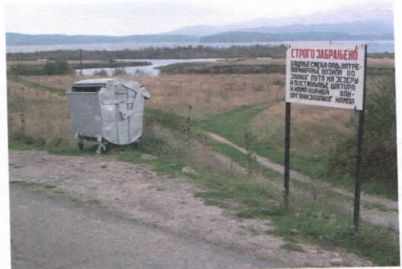
Власина никад чистија

Овде је само део активности ЈП „Водовод“. Подигли смо ниво комуналне хигијене у целој Општини, нарочито на Власини. Зимска служба је углавном одговорила својим обавезама. Стабилизovali смо водоснабдевање, и у тој области очекујемо нове инвестиције у 2006.год. Активности овог предузећа полако ћемо ширити на села, покушати да освежимо и обновимо возни парк, да увећамо број корисника услуга предузећа. Није још увек све на нивоу на којем желимо али верујемо да ћемо упорношћу и уз одговорност постићи све.