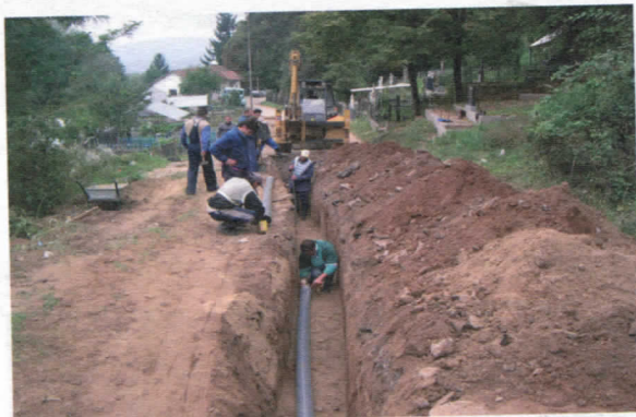
Водовод у Доњем Романовцу