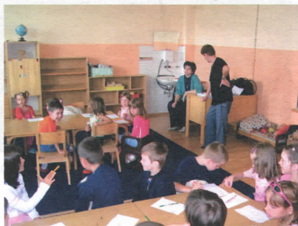
Обданиште у Белом Пољу – адаптирано после 16 година