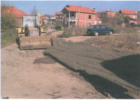
Загузање, чишћење шанца