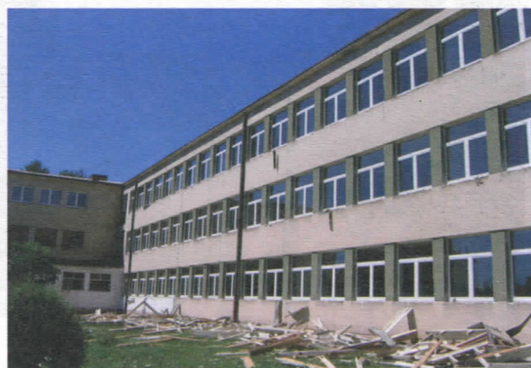
ПШШ „Јосиф Панчић“ нова столарија