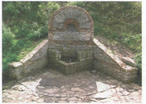
Чесма, Власина Рид