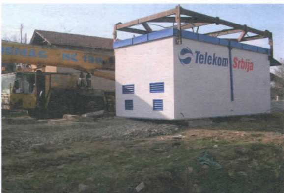
Након година обмањивања, села Сувојница и Дугојница добиће телефоне