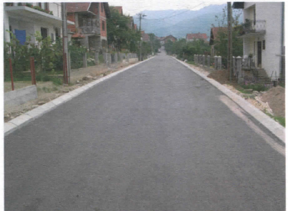
Ул. Драгице Жарковић