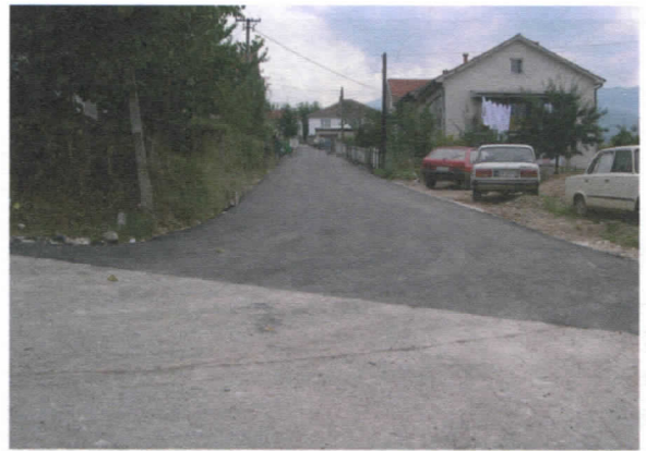
Ул. Др. Рајса