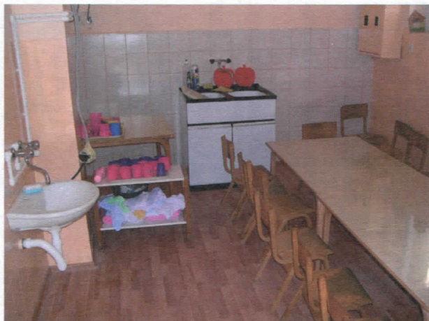
Обданиште у Сувојници- кухиња