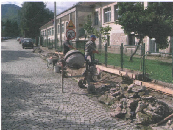
Радови на санацији оградае