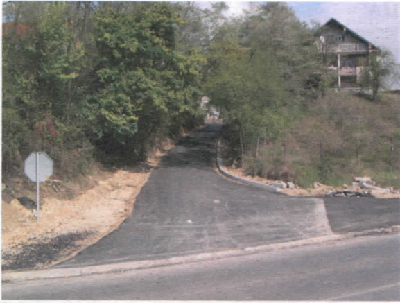
Пут према Загужањском гробљу