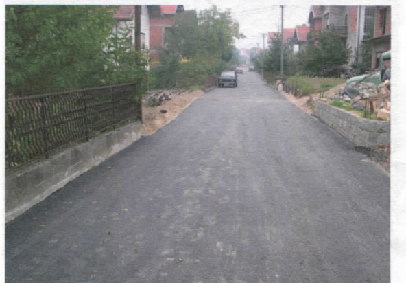
Ул. Мирка Стојановића

У протеклој грађевинској сезони уградили смо 14.500 м 2 новог асфалта, 9.500 м 2 гребаног асфалта, а око 5000 м 2 асфалта утрошено је на крпљење и санацију локне путне мреже. Интензивну сарадњу имамо са Републичком дирекцијом за путеве, која је започела санацију регионалне и магистралне путне мреже у Општини. На основу обећања очекујемо да ће се сарадња наставити у 2006.год. и да ће уговорени послови у протеклој години бити реализовани у текућој.