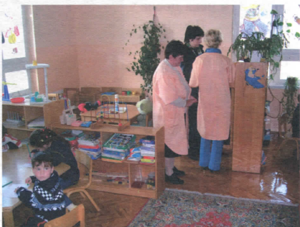
Обданиште у Биновцу