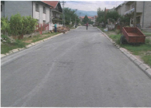
Ул. Јужноморавских бригада