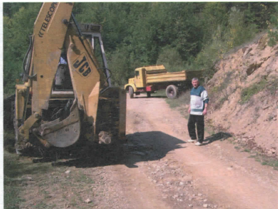
Стругани асфалт у МЗ Драинце

У 2005.години већи део радова био је концентрисан на подручју града. У текућој, биће обрнуто. Дobar део Месних заједница је адекватно сагледан и у 2005.год. У овом делу функционисања локалне самоуправе, јавио се проблем опструкције од стране појединих председник савета МЗ. Разлози су пре свега политички и врло брзо ћемо то да превазиђемо у интересу грађана. Утврдићемо нове принципе месне самоуправе који ће бити ефикаснији и конструктивнији.