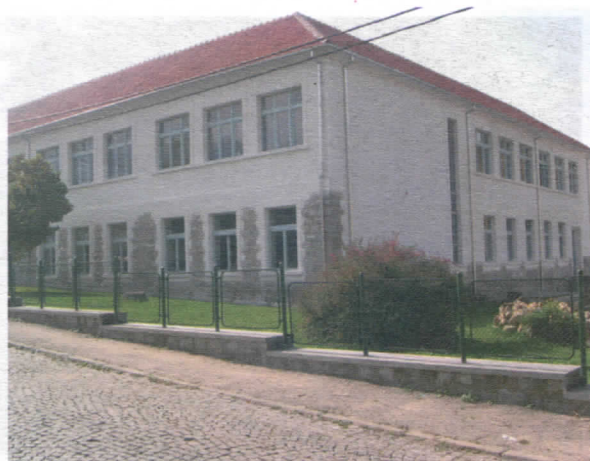
ОШ Ј.Ј.Змај, реконструисан кров, фасада и део оградае

И у предизборним обећањима приоритет смо давали најмлађима. Све ове послове урадили смо из сопствених средстава, уз помоћ Министарства просвете и у сарадњи са УНДП-ем.. У основним и средњим школама за радове који су изведени Општина је издвојила 3.605.829,00. Ова средства уложена су у сопствене пројекте или као учеће у пројктима са УНДП-ом. Значајна средства обезбеђена су у Министарству просвете за реконструкцију столарије и износе преко 35 милиона. Ове активности настављамо и у 2006.год.