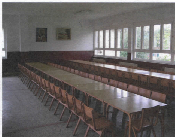
Нова столарија у ОШ у Јелашници