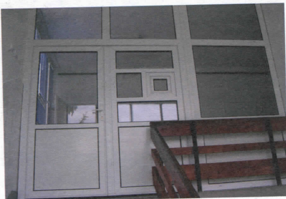
Нова столарија, гинеколошко одељење