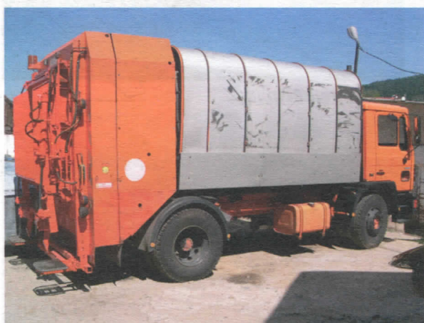
Камион донација из Аустрије