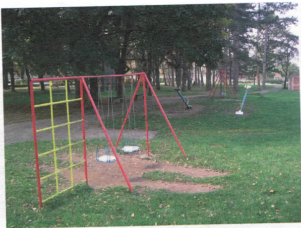
Дечији парк, поново насмејан