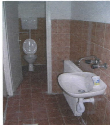
Нова купатила за болеснике

Иако нам није законска обавеза, већ у првој години вршења власти трудили смо се да помогнемо, у складу са могућностима, унапређењу здравствене заштите у Сурдулици. Кроз различите пројекте инвестирали смо или саучествовали у пројектима УНДП-а са 1.180.180,00 дин. за Здравствени центар. Специјалној болници за плућне болести обезбедили смо 602.331,20 дин из Буџета, а ова средства утрошена су за куповину неопходне опреме.