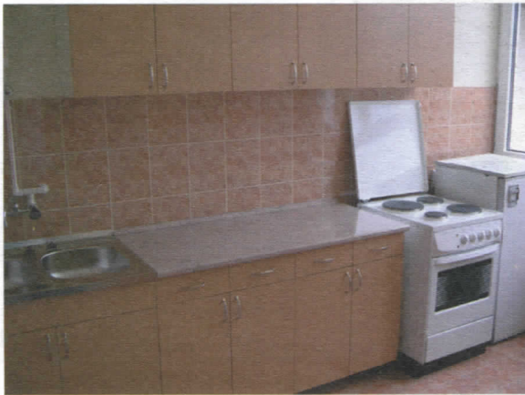
Кухиња у новом издању