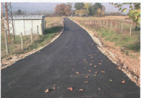
Пут до гробља у Масурици