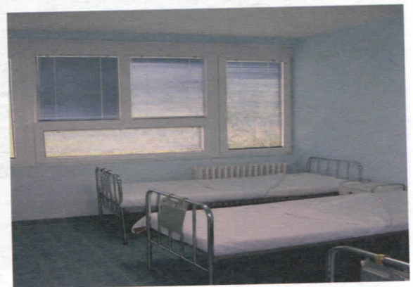
Изглед собе након адаптације