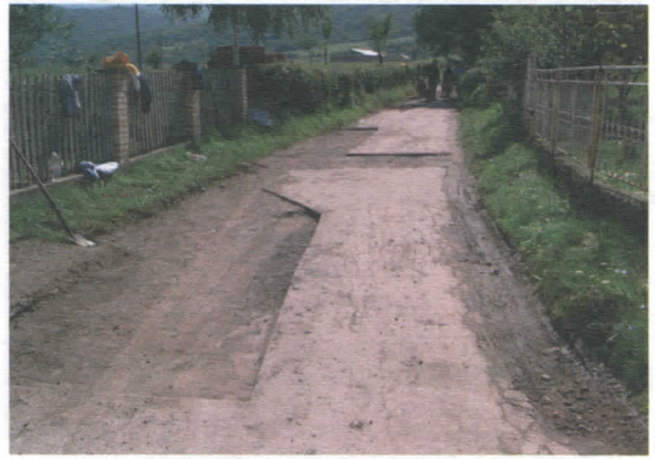
Крљење локалног пута у Сувојници