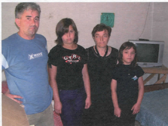
Телевизор, поклон питинског одбора породици у Доњем Романовцу