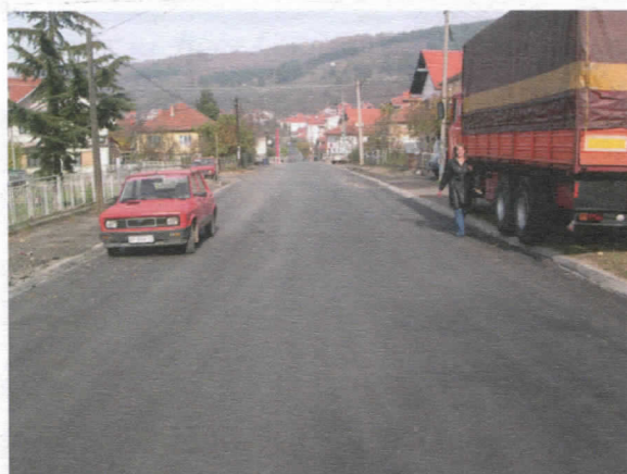
Ул. Вука Караџића