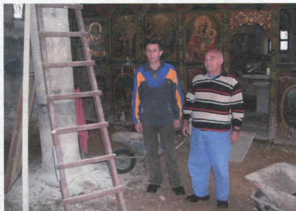
Реконструкција цркве у с.Клисури

Значајна средства издвојили смо и за цркву. За санацију цркве у Клисури, за реконструкцију у манастиру у Паљи. У овој години очекује нас инвестирање у звоник у храму Св. Ђорђа у Сурдулици. Износ одређених средстава је 1.500.000, дин.