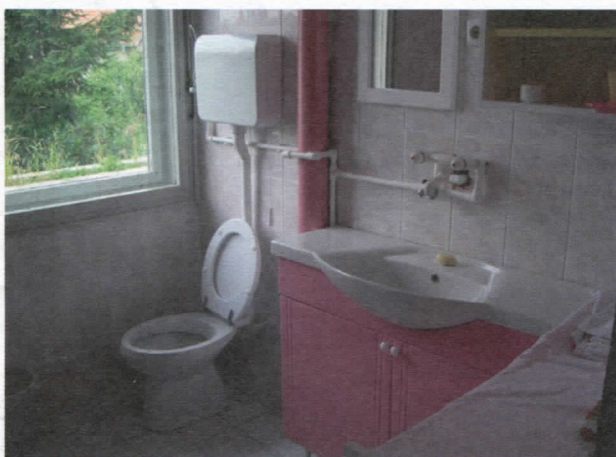
Нова купатила за најмлађе-објекат у граду

Сва обданишта на територији Општине, ново руководство је адаптирало. Нека после 3, а нека после 16 година. Вредност радова је 1.244.985,00. Средства су обезбеђена из сопствених средстава установе и Буџета Општине. Сви наслеђени дугови су измирени.