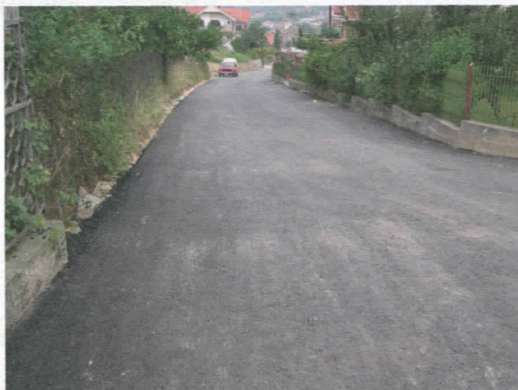
Ул. Милутина Стојановића Комуне