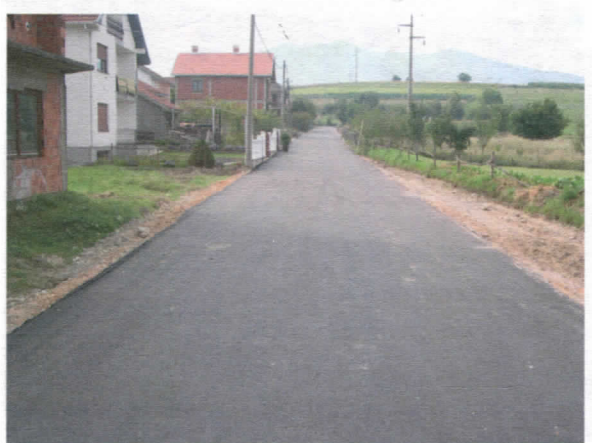
Ул. Настаса Дојчиновића

У протеклој грађевинској сезони уградили смо 14.500 м 2 новог асфалта, 9.500 м 2 гребаног асфалта, а око 5000 м 2 асфалта утрошено је на крпљење и санацију локне путне мреже. Интензивну сарадњу имамо са Републичком дирекцијом за путеве, која је започела санацију регионалне и магистралне путне мреже у Општини. На основу обећања очекујемо да ће се сарадња наставити у 2006.год. и да ће уговорени послови у протеклој години бити реализовани у текућој.