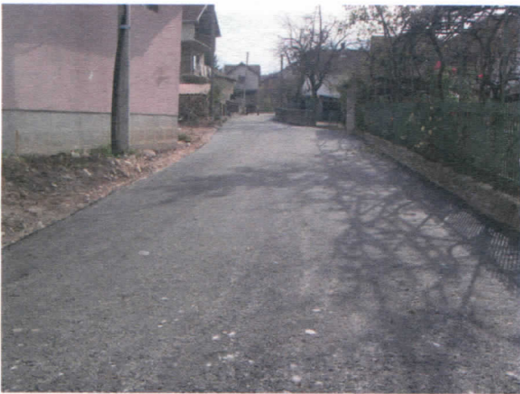
I крак ул. Васе Смајевића