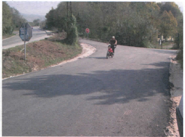
Улаз у Алакинце