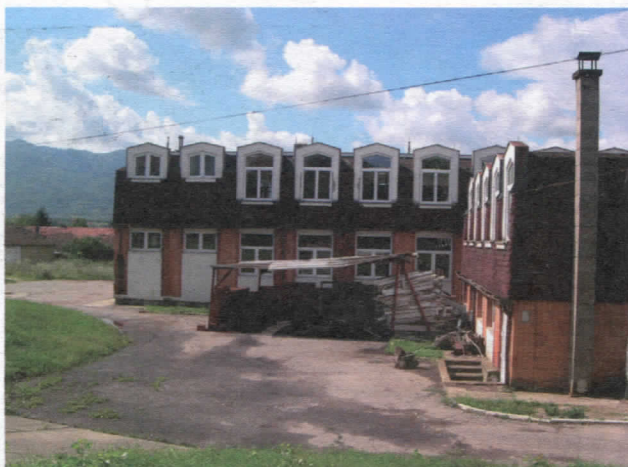
ОШ „Пера Мачкатовац“ нова столарија