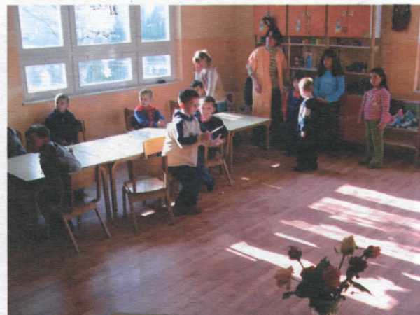
Обданиште у Сувојници- нови амбијент