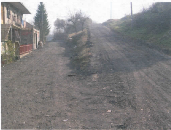
Стругани асфалт - с. Алакиње