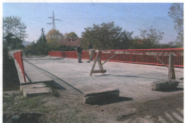
Реконструкција моста у Масурици у сарадњи са Власинским ХЕ