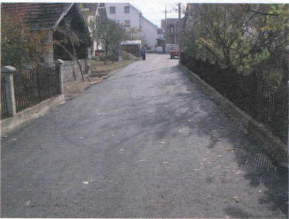
III крак ул. Васе Смајевића

ЈП „Дирекција за путеве и грађевинско земљиште“ је свој план за 2005.год. не само остварила него и премашила. Планирано је 36, а реализовано је 52 милиона динара и највећи део средстава утрошен је на инфраструктуру. Динамика радова ће се наставити и ове године, а од суграђана очекујемо пре свега стрпљење и наравно поверење. Проблеми су велики али нису нерешиви. Убеђени смо да ће се сва предизборна обећања бити испуњена у овом мандату нове локалне власт.