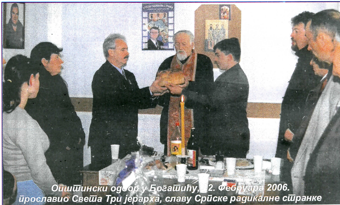
Општински одбор у Богашићу, 2. Фебруара 2006. Њпрославио Свеиша Три јерарха, славу Српске радикалне странке