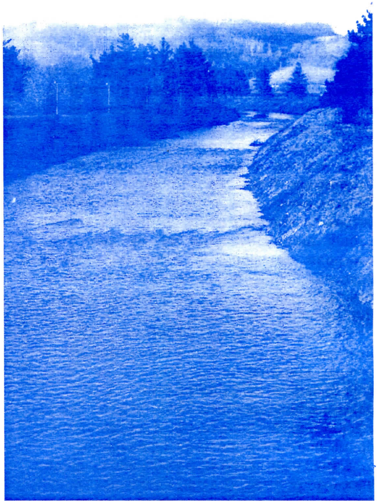
Уређење речног корита у Љигу

Даљим својим учешћем у власти трудимо се да наставимо посао који смо започели у претходних годину дана, у нади да у будућем периоду нећемо трошити време и стрпљење на мирње српске браће, завађене од Косова па до данас. Надамо се да смо бар