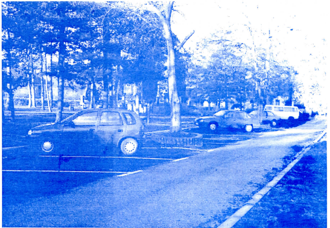
Уређење паркинг простора у граду