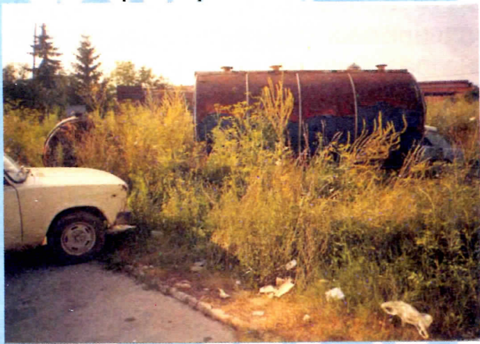
Скупо плаћен катао