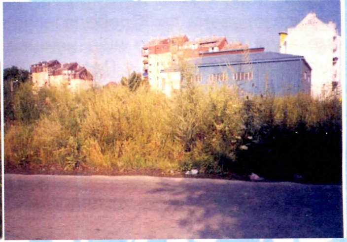
Коров око и у ЈКП "Чачак"

До доласка на власт обећавали су много. Ништа нису испунили. Све су слагали и то су свесно чинили. Али не мисле да силазе са власти, јер знају да би тада морали да одговарају пред лицем правде и судом народа.