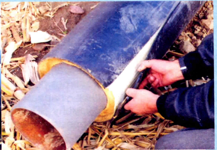
Цеви првог квалитета – МАГИСТРАЛНИ ТОПЛОВОД