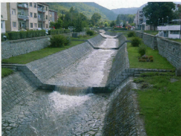
Река Врба - нови изглед кеја