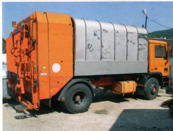
Камион - донација из Аустрије