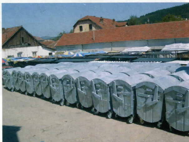
80 нових контејнера за чистији град

Град се редовно чисти, улице су почеле да се перу, а у режим одржавања ЈП "Водовод" полако улазе и села на територији Општине. Нарочито велики акценат је бачен на подручје Власине где је за само месеце дана сакупљено 60 камиона комуналног отпада.