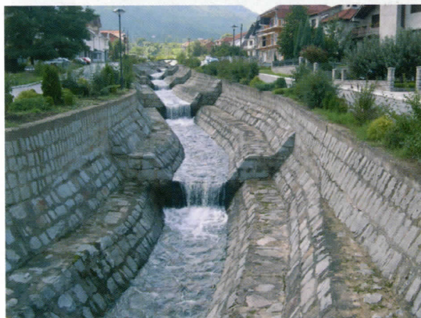
Кеј на Романовској реци

У комуналном смислу Општина изгледа потпуно другачије.