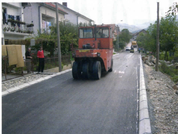
Ул. Драгице Жарковић