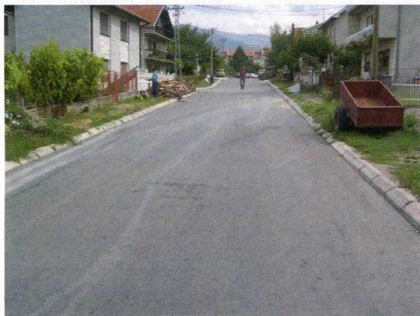
Ул. Јужноморавских бригада

У сарадњи са Републичком дирекцијом за путеве у овој години реконструисаћемо регионални путни правац М1 13 од с. Турковице до Белог Поља и као његов алтернативни правац ул. Томе Ивановића целом дужином кроз град. Вредност ових радова биће преко 40 милиона дин.