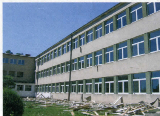
ПШШ "Јосиф Панчић" - нова столарија

Очекујемо да следеће године будемо још бољи и успешнији. Биће простора јер ћемо се до тада највећег дела наслеђених дугова решити, и новацем наших грађана нећемо плаћати нечије будалаштине, него га улагати у лепшу и бољу Сурдулицу.