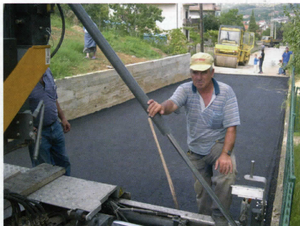
Ул. Милутина Стојановића Комуне