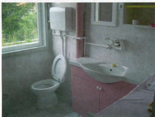
Дечје обданиште - огледало одговорних

Комплетну спољну столарију заменили смо и на ПШШ "Јосиф Панчић" у којој ћемо до краја године реконструисати и анекс свечане сале - Ђачки парламент. Замену столарије до краја године очекујемо и у ОШ "Бора Станковић" у с.Јелашница а укупна вредност радова око столарије по завршетку биће 35,4 милиона дин.