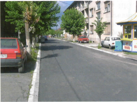
Ул. 5-ти септембар