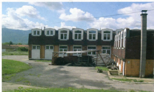
ОШ "Пера Мачкатовац" Бело Поље

Комплетну спољну столарију заменили смо и на ПШШ "Јосиф Панчић" у којој ћемо до краја године реконструисати и анекс свечане сале - Ђачки парламент. Замену столарије до краја године очекујемо и у ОШ "Бора Станковић" у с.Јелашница а укупна вредност радова око столарије по завршетку биће 35,4 милиона дин.