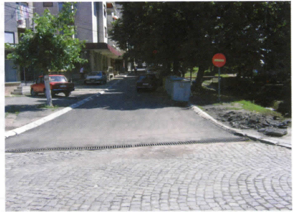
Ул. Војводе Мишића