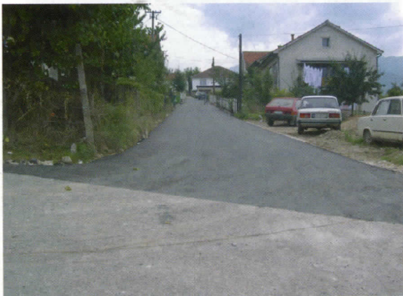
Ул. Др Рајса