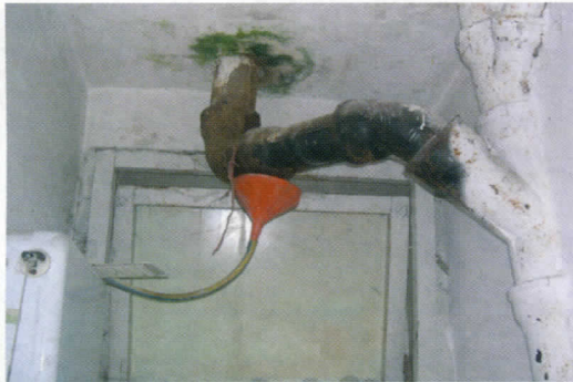
Дечије обданиште - брука претходника

Много пажње посвећено је и прешколској установи, основним и средњим школама. Обданиште "Наша радост" добија сјај и изглед који заслужује. У ОШ "Пера Мачкатовац" у Белом Пољу реконструисан је систем за грејање, а у сарадњи са министарством просвете замењена је комплетна спољна столарија.