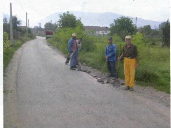
с. Алакинце - реконструкција пута