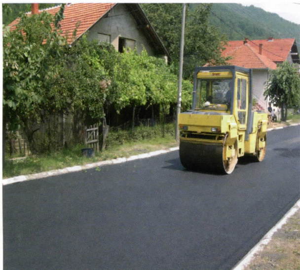
Деоница регионалног путног правца М1 13 који пролази кроз град

ЈП "Дирекција за грађевинско земљиште и путеве" ће до краја грађевинске сезоне инвестирати у путну и другу инфраструктуру преко 32 милиона дин. Нови асфалт добиће 23 улице, а по решавању имовинско-правних односа и преосталих неколико улица у граду биће завршене идуће године.