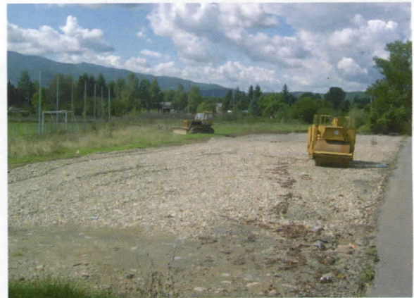
Изградња паркинга за тешке камионе