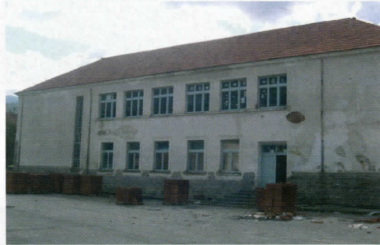
ОШ "Ј.Ј Змај" - замењен кров, на реду је реконструкција фасаде

На ОШ "Ј.Ј Змај" реконструисан је кров, поправљена је ограда школског дворишта, а тренутно се сређује и спољна фасада. На основу обећања из министарства просвете, очекујемо да идуће године променимо комплетну столарију.