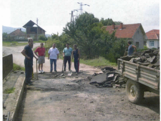
с. Масурица - реконструкција моста