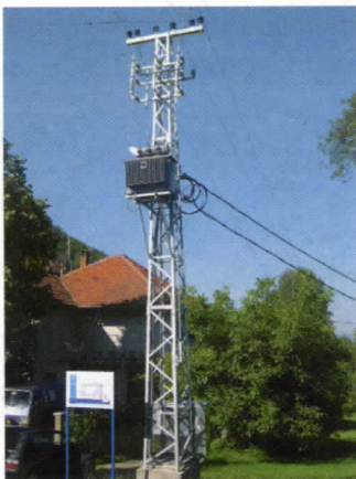
Стубна трафо станица с. Ђурковица - Парануде

У селу Ђурковица стављена је стубна трафо станица у сарадњи са UNDP-ом, решен је проблем са slabим напоном.