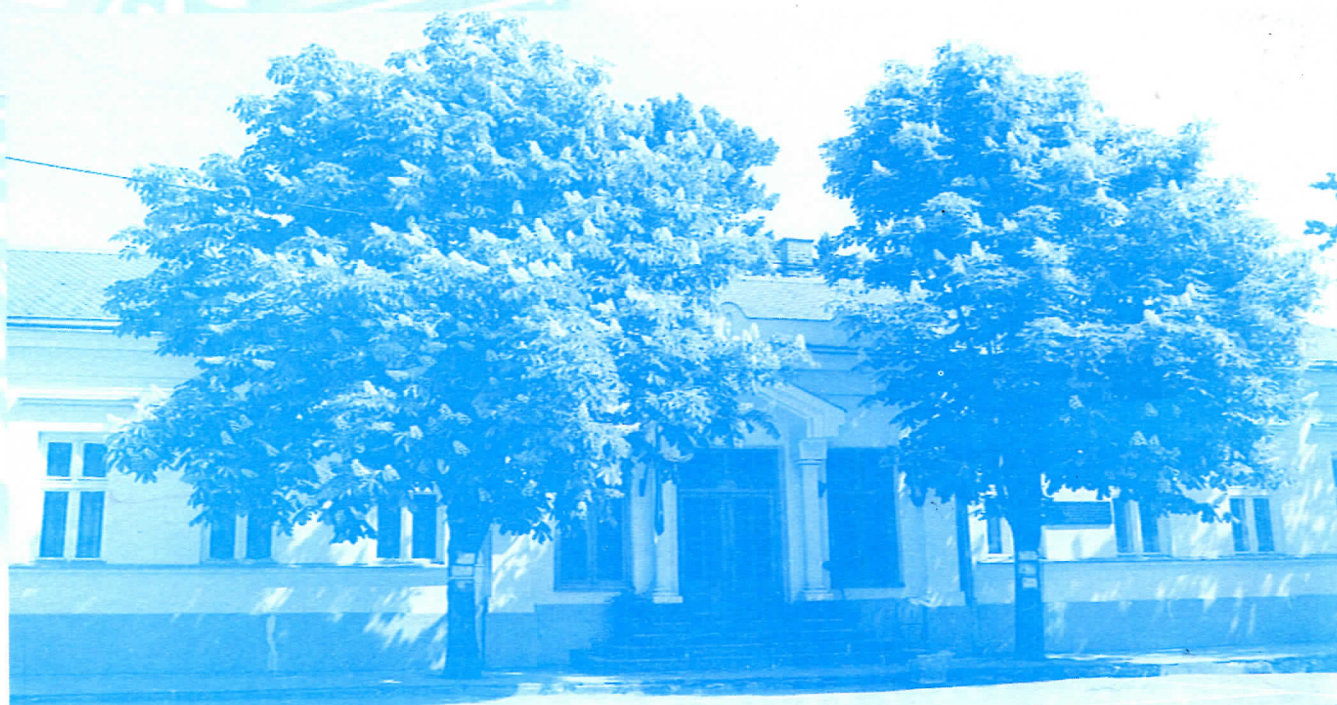
Зграда Општине Жагубица

Ефикасност и ажурност у делу комуналне инспекције ове године је драстично повећана у односу на прошлу годину. Само у априлу месецу 2005.године одрађено је 70 управних предмета наспрам 40 колико је обрађено током целе 2004.године. Увођење олакшица предузетницима при плаћању комуналних такси први пут је резултирао тиме да је тренд оснивања радњи знатно већи. Пракса показује да је ранијих година број пријављених и одјављених радњи увек био у равнотежи, док је само у првој половини ове године однос 3,5 : 1 у корист пријављених.