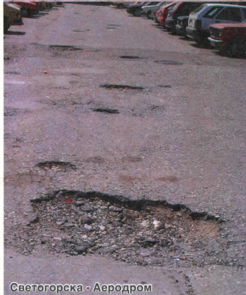
Светогорска - Аеродром

Српска радикална странка је неиресијано преко своје одборничке групе у Скупштини града Крагујевца, настојала да кроз одборничка питања укаже на зоруће проблеме у свакодневном животињу својих суграђана, као и да намера актуелног градоначелника да те проблеме решава. Ово је само део проблема на које смо ми српски радикали указивали током ових једанаест месеци свога деловања у Скупштини Града.