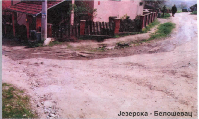
Језерска - Белошевац