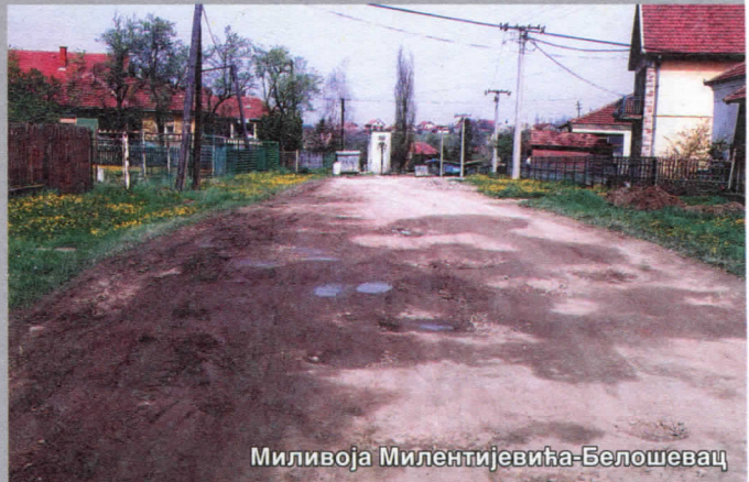
Миливоја Милентијевића - Белошевац