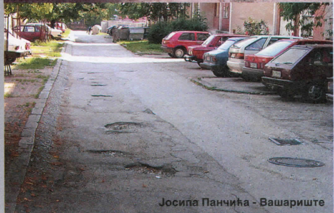
Јосипа Панчића - Вашариште