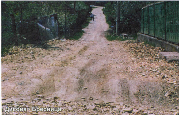
Дисова - Бресница