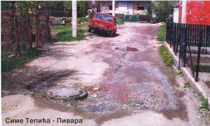
Симе Тепића - Пивара