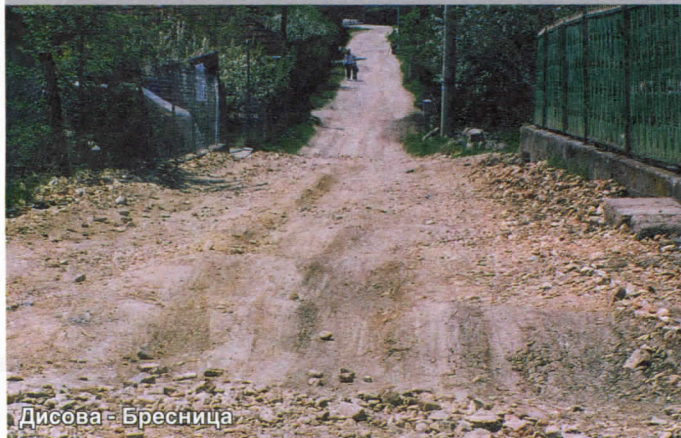
Дисова - Бресница