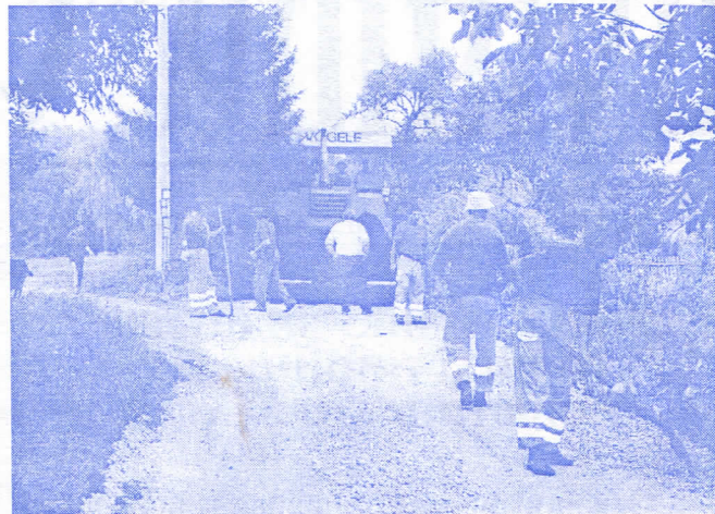
Радови у Љигу - не по политичкој припадности, већ тамо где је неопходно

Ми, српски радикали сматрамо да ћемо једино на такав начин мотивисати целокупну заједницу да се укључи у овај наш заједнички посао, а на задовољство свих грађана општине Љиг.