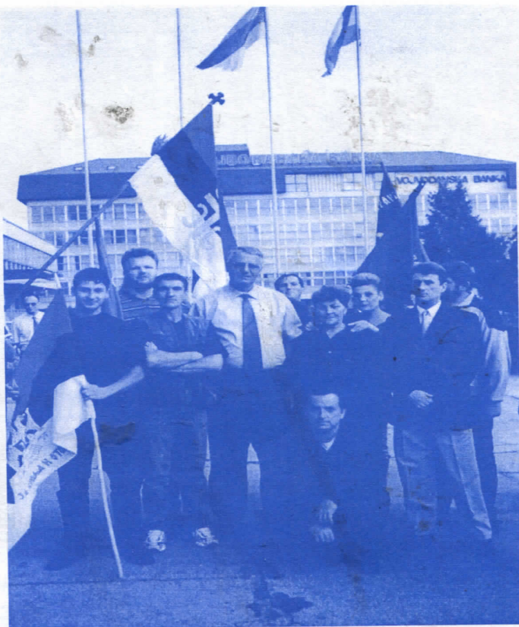
Општински одбор СРС М. Иђош.

Дана 10.07.2005. год. одржани су избори за савете МЗ наше општине. Општинска организација СРС је освојила два мандата за Савет МЗ Ловћенац и један мандат за Савет МЗ М. Иђош. Савети МЗ Фекетић и МЗ М. Иђош су конституисани али Савет МЗ Ловћенац још увек није јер није дошло до договора између изабраних чланова Савета са листа које су учествовале на изборима. Што се тиче ОО СРС је била спремна да преговара са представницима свих листа осим са представницима листе која је носила назив Црногорска листа с обзиром да се иза тог назива листе крије удружење КРСТАШ . Сви које интересује рад и циљеви тог удружења могу прочитати саопштења на њиховом сајту ( www.geocities.com/udruzenjesnogoraca/ ). Та саопштења су пуна лажи о наводној угрожености Црногораца у Србији коју они називају дијаспором. Такође се види њихово залагање за самосталну Црну Гору што је само један од доказа да су продужена рука режима Мила Ђукановића у Војводини.