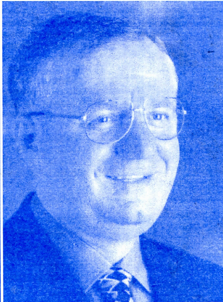
ДР. ВОЈИСЛАВ ШЕШЕЉ ХАШКИ ТРИБУНАЛ НА КОЛЕНИМА

Ово је најбољи доказ да је Општински одбор Српске радикалне странке Стара Пазова био у праву када је у истом броју листа Велике Србије тврдио да у Општини Стара Пазова не