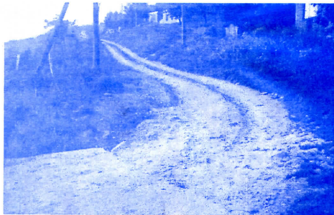
Улица Моше Пијаде

Тренутна ситуација намеће само један закључак: неке ипак није стало да се радови око овог пројекта започну, а камоли заврше.