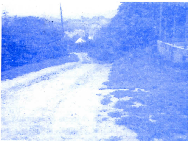
Змај Јовина улица

И поред донете одлуке, одобрених и обезбеђених средстава, са радовима се није започело ни до дана данашњег. Правог кривца је тешко именовати јер се кривица пребацује са једних на друге, од месне заједнице, преко Општине, све до Сремпута. Међутим, мештанима села Нерадина и није битно КО ЈЕ КРИВ, већ да радови започну и улица добије изглед улице, а не пољског пута.