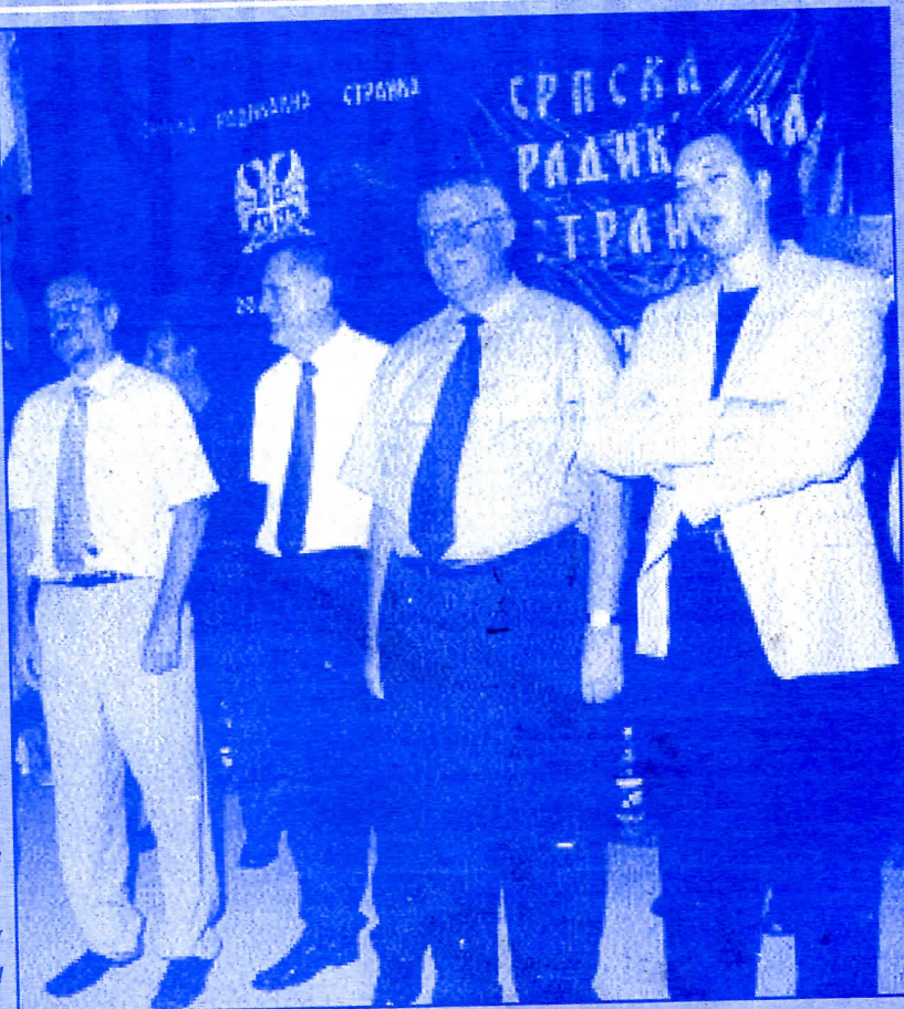
Посета Др проф. Војислава Шешеља Врању

Наша подршка председнику радикала није подршка само једном човеку да издржи у тој праведној борби, већ је то и наша spremnost да се кроз његову борбу и жртву и ми боримо за Србију и њен национални интерес.