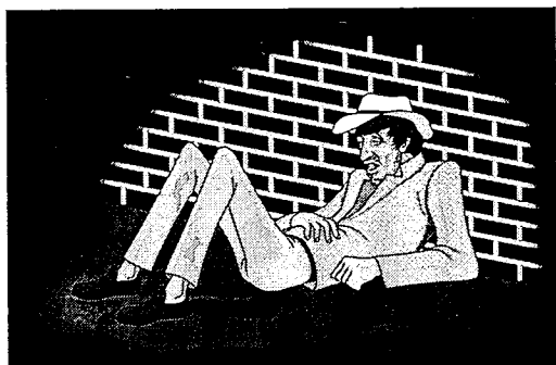
Будућности са овом влашћу

"Зидару", "Моди", занатском "Лозница" итд. да не помињемо. И зато питамо шта је са "Агенцијом за развој општине Лозница" коју сте обећали.