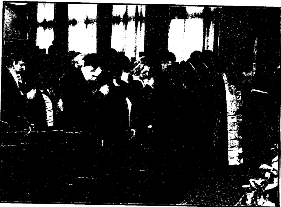
Годишња скупштина Општинске организације Српске радикалне странке Смедерево 2005.

Уз Божју помоћ и народну вољу, ми, српски радикали, се надамо да ћемо што пре, колико још у току ове године доћи на власт и моћи да докажемо да смо патриотска странка која потиче из народа и бори се за српски народ без обзира на верску опредељеност или националну припадност.