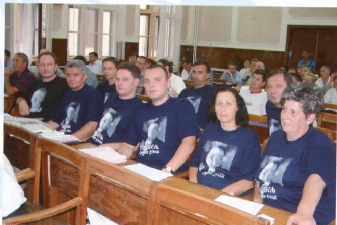
Одборничка група Српске Радикалне Странке у локалном парламентију

Представници СРС у локалној самоуправи су се у предходном периоду залагали за највиши степен одговорности, отворености и јавности рада општинских органа, као и за редовне директне ТВ и радио преносе свих заседања СО. Присутност представника СРС у третирању и решавању свих проблема који су битни за квалитетнији живот грађана општине Лесковац је евидентан. Приоритет се даје завршетку основних школа у Богојевцу, Разгојни, Грданици, Граову, Брзи и Турековцу; реконструкцији и доградњи објекта "Девет Југовића" за целодневни и полудневни боравак деце предшколског узраста; изградњи фискултурне сале за потребе школе Трајко Стаменковић. Акценат је стављен на изградњу Центра за дневни боравак деце са посебним потребама у саставу Специјалне школе - 11. октобар. Вредност овог пројекта је 10 милиона динара а финансираће га локална самоуправа.