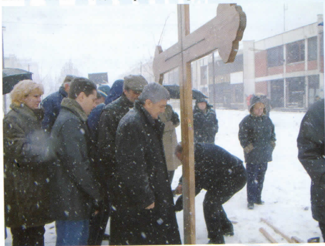
Посјављање крста за изградњу цркве Светог Симеона Мироточивог

У почетној фази реализације су следећи пројекти: Нацрт Плана развоја општине Лесковац за 2004 - 2005 год., изградња цркве Светог Симеона