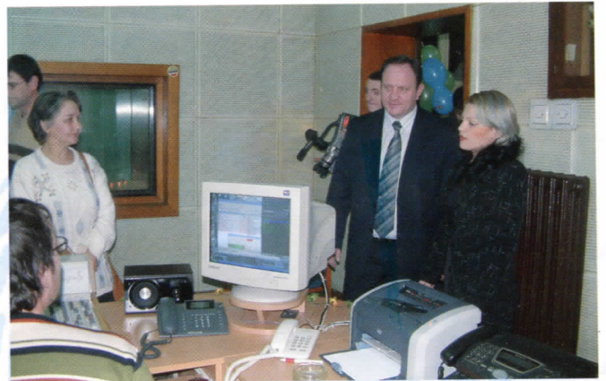
Инсталирање нове опреме у ЈП Радио Лесковац

Приоритет у плану за 2005. годину да је се поновном покретању Другог програма Радио Лесковца који је прекинут због дотрајалости технике 1999. године. Пратећи савремене трендове пословања директорка се ангажовала на представљању предузећа и путем сајта.