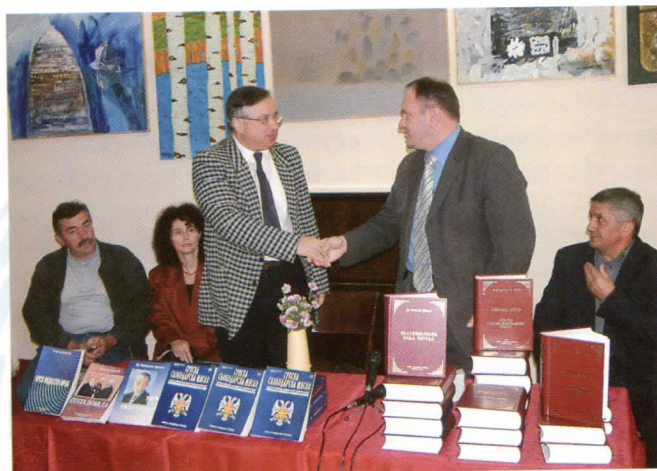
Поклон комилејног издања дела др Војислава Шешелја Народной библиотеци

Мироточивог у Дубочици, изградња Услужног центра, изградња пет мостова на Морави као и висећег моста у Предејану, завршетак расвете у насељеним местима Аиште и Јабукар у Предејану, Грданици асфалтирање пута Барје-Оруглица и изградња нове аутобуске станице. У 2004-ој години локална самоуправа је уложила у комуналну инфраструктуру 21. 025. 485 динара и тиме знатно побољшала квалитет живота становништва у општини Лесковац. Радикали су својим ангажовањем у функционисању локалног Парламента доминантан фактор који улива поверење и истрајност у реализацији свих пројеката. Својим залагањем дали су пример за рад локалне самоуправе као сервиса грађана.