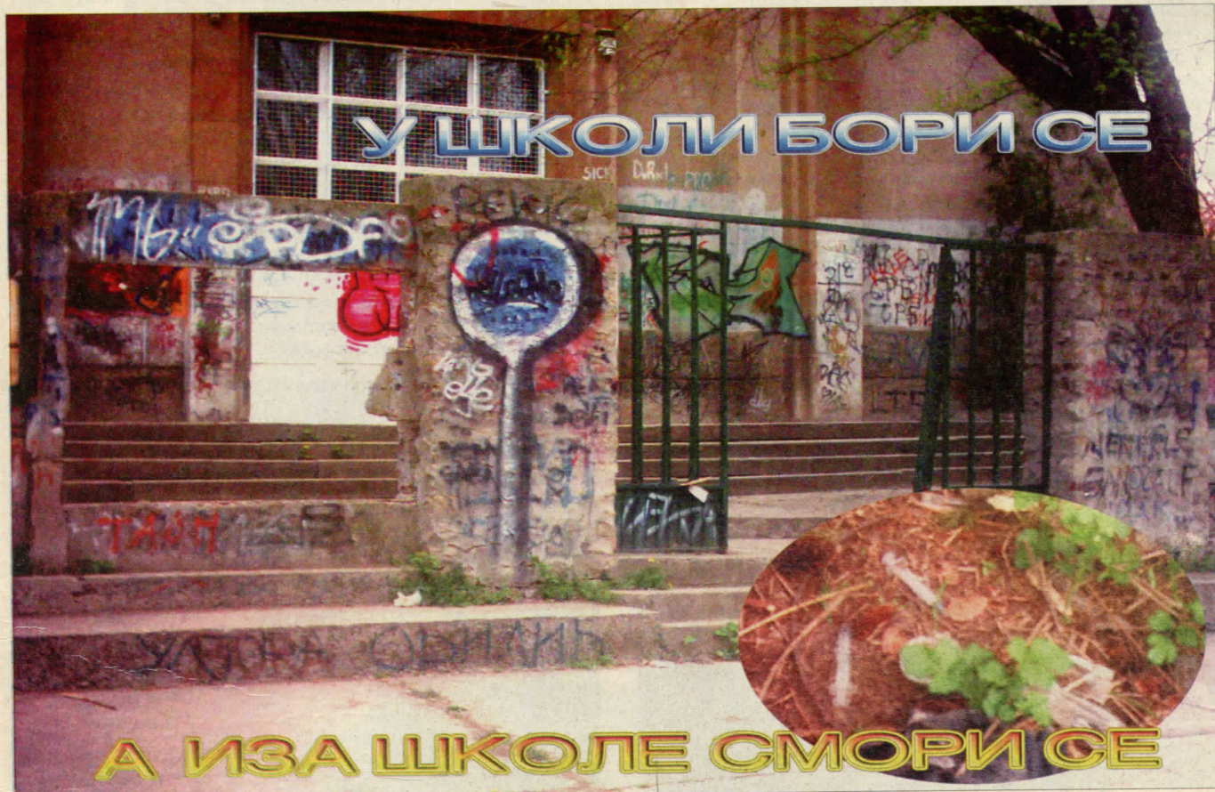
Улаз у Осму Београдску гимназију

Искрено ваш Општински Одбор Вождовац Српске Радикалне Странке