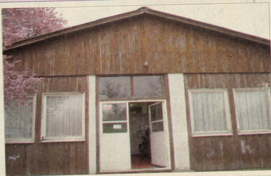
Амбуланта у Кумодражу II