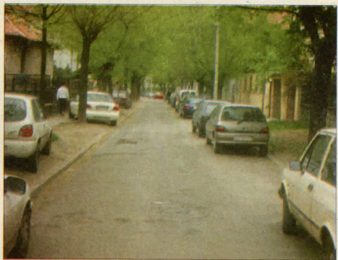
У најлошијем стању су баш улице које су некада биле понос Вождовца