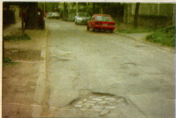
Улица Јове Илића