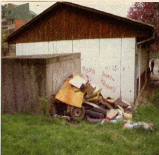
Модерно здравство 21-ог. века