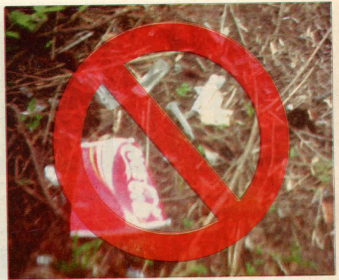
Простор иза Осме Београдске гимназије (наркоманско гнездо)