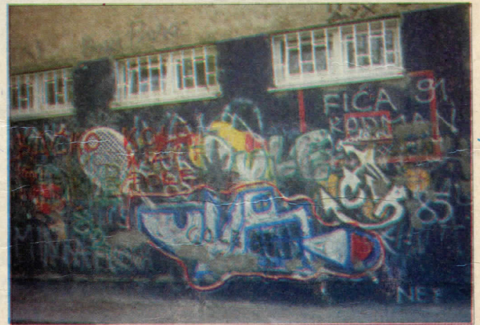
О.Ш. Карађорђе - лице и наличје