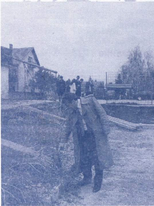
Неодговорност и јавашлук, срушен зид спортске хале у изградњи