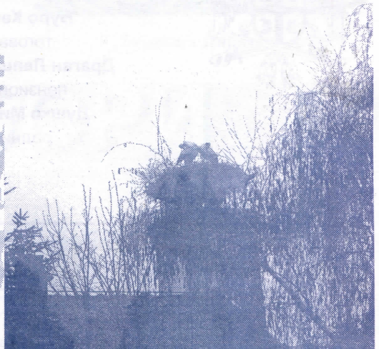
Пролеће је дошло - роде у Сурдуку -

Ово је једно од ретких места у Војводини па и у целој Србији где је љубав према коњима одржала своју традицију.