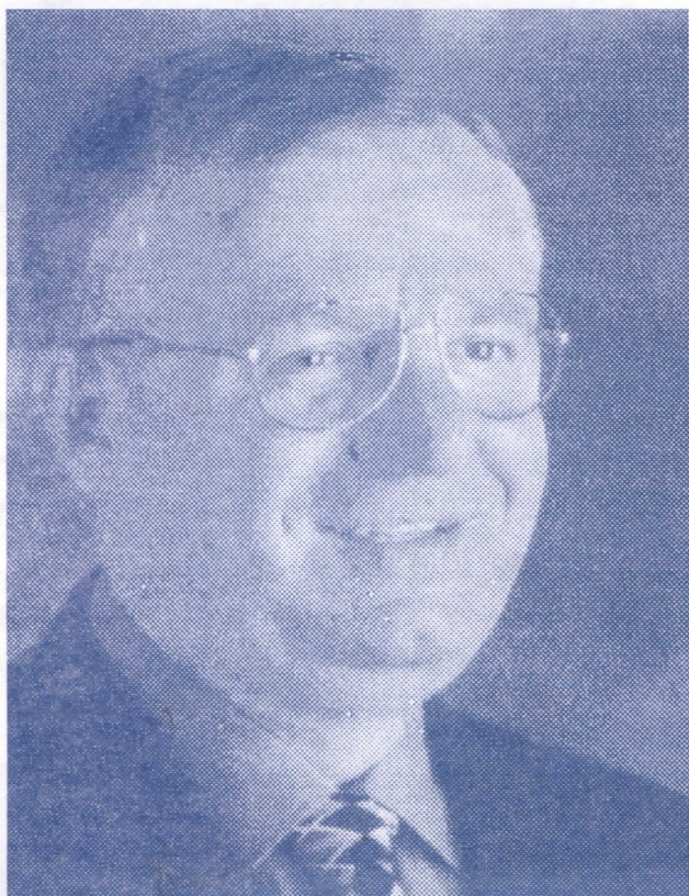
ДР. ВОЈИСЛАВ ШЕШЕЉ ПОБЕДИЊУ ХАНШКИ ТРИБУНАЛ

СУРДУК, АПРИЛ 2005. ГОДИНЕ ГОДИНА XVI, БРОЈ 1990