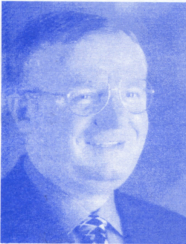
ДР. ВОЈИСЛАВ ШЕШЕЉ ПОБЕДИЋУ ХАШКИ ТРБУНАЛУ

НОВА ПАЗОВА, АПРИЛ 2005. ГОДИНЕ ГОДИНА XVI. БРОЈ 1984