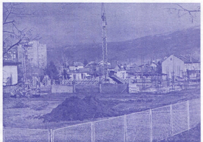
Почетак радова на изградњи спортске хале