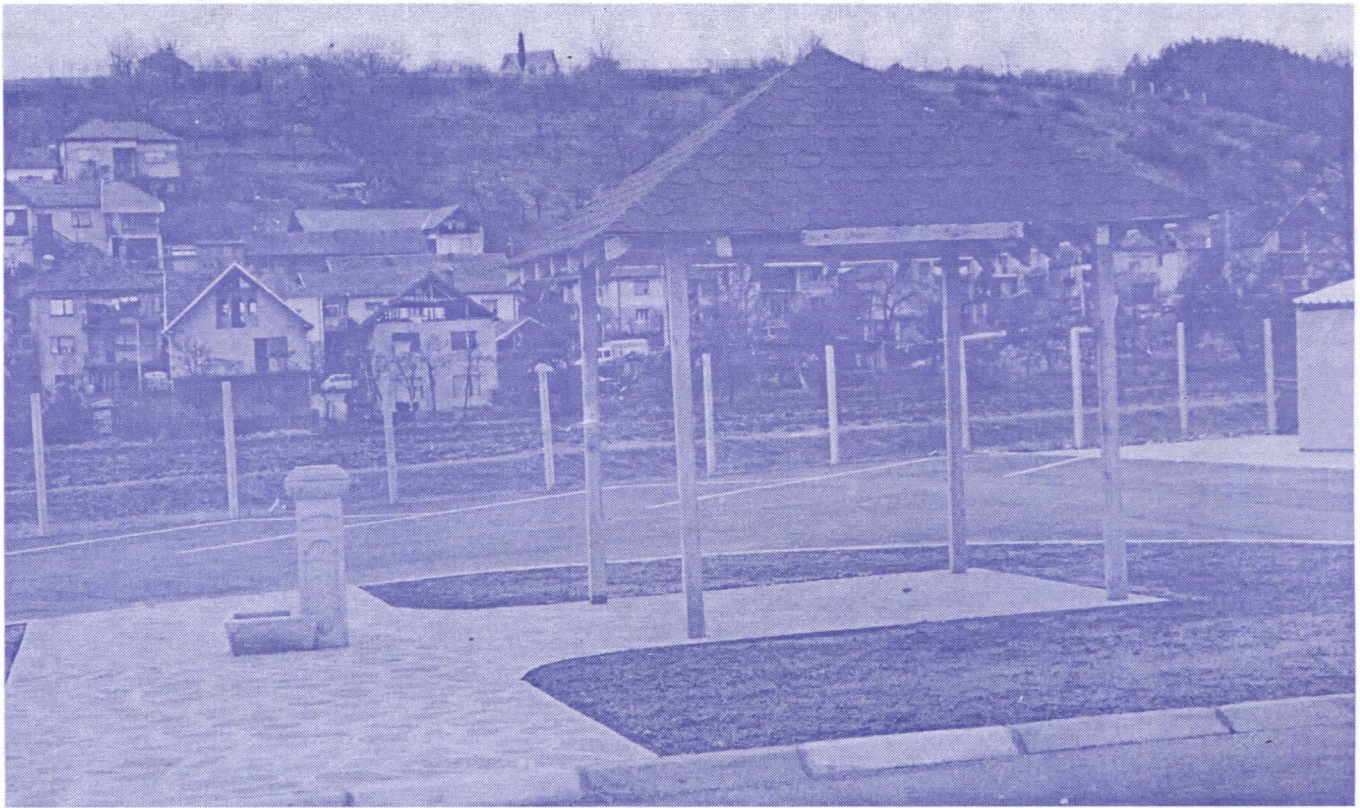
Ново рухо робне пијаце . . .

Иницијатива одборника Српске Радикалне Странке била је значајна и код уређења зелене и робне пијаце.