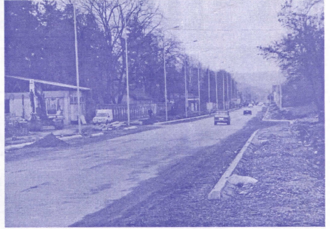
Радови на реконструкцији улице Никола Пашић

Крајем прошле године почела је реконструкција улице Никола Пашић, многе улице су закрпљене а добар део улица је пресвучен новим асфалтним слојем.