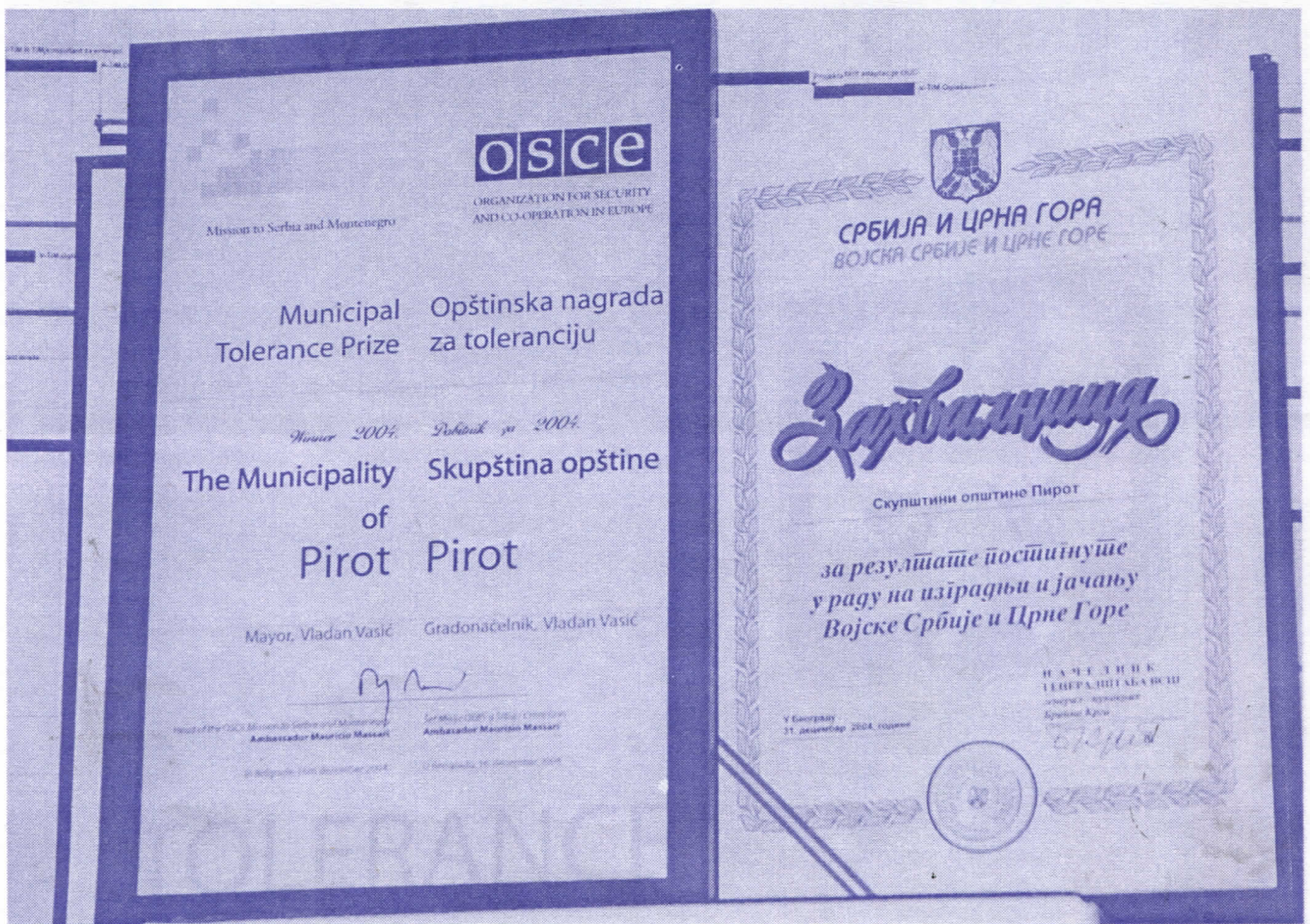
Награде Општини за најтолерантнију Општину у Србији и награда Генералштаба војске СЦГ.

Да је СРС странка која жели да сарађује са свима који добро мисле своје народу показују и награде и признања које смо као део локалне власти добили ове године. Ово су признања за све наше суграђане и велики подстрек за све нас да завршимо започето и кренемо у нове инвестиције.