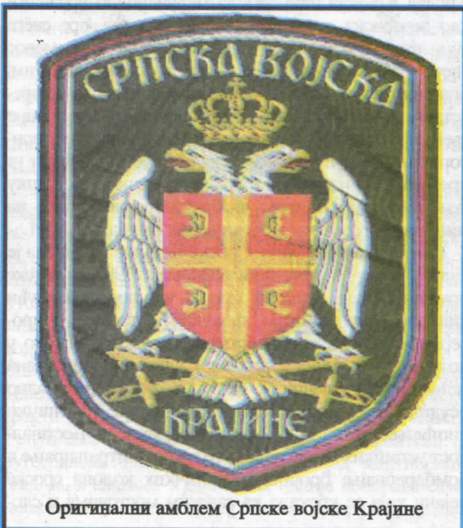
Оригинални амблем Српске војске Крајине