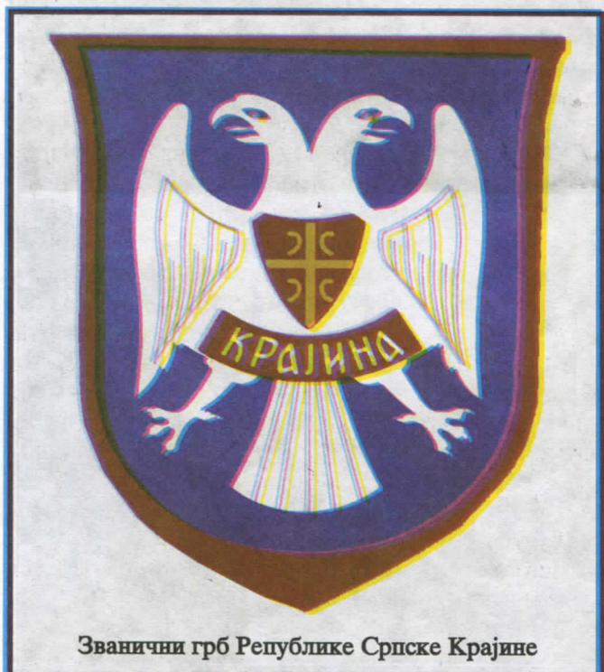
Званични грб Републике Српске Крајине