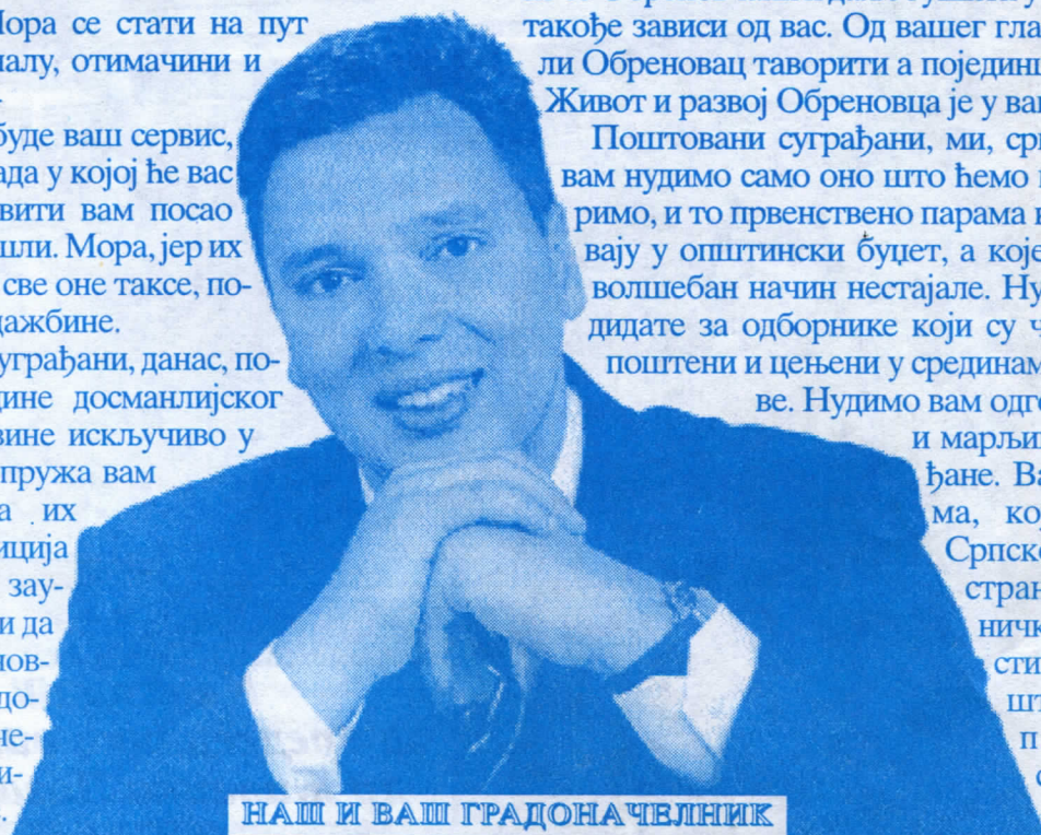
НАШ И ВАШ ГРАДОНАЧЕЛНИК

Поштовани суграђани, ми, српски радикали вам нудимо само оно што ћемо моћи да остваримо, и то првенствено парама које се већ сливају у општински буџет, а које су до сада на волшебан начин нестајале. Нудимо вам кандидате за одборнике који су часни, честити, поштени и цењени у срединама у којима живе. Нудимо вам одговорне, вредне и марљиве ваше суграђане. Вашим гласовима, које ћете дати Српској радикалној странци у одборничке клупе ће сеести и полуге општинске власти преузети следећи наши кандидати: