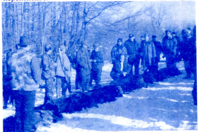
Сан сваког ловца, јавља уз радикалску власт – богајна ловишћа

3. Уз ангажовање тима способних и проверених људи у маркетингу и економији, представити Општину свим расположивим средствима као еколошку, здраву средину погодну за туризам и инвестирање у погоне за производњу здраве хране, воде итд, у ту сврху помоћи материјално и организационо удружења ловаца и риболоваца, како би се појачао ловни и риболовни фонд и привукли туристи из иностранства али и из окружења. Завршетак спортске хале и изградња пратећих објеката је један од приоритета радикалске већине, то је нешто што је РЕАЛНО могуће окончати у року од две године. Завршетком хале повећава се туристичка понуда, а тиме и број туриста и укупан приход како грађана тако и Општине и отварају даље перспективе.