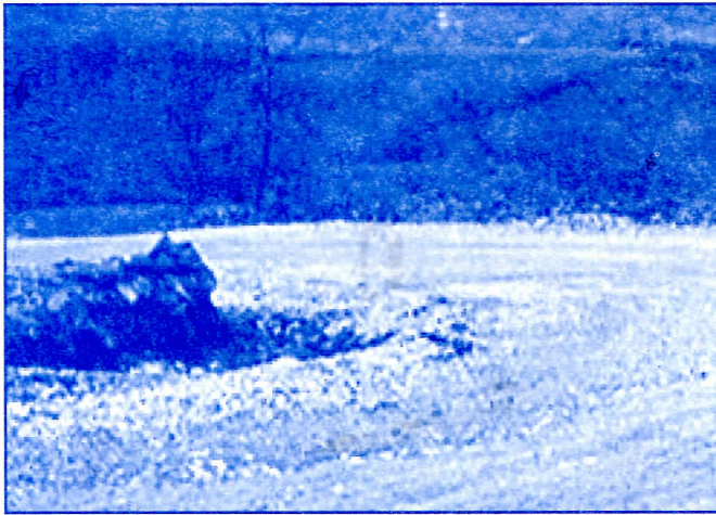
боље н'о што беше ( за почетак )

заинтересованим за изградњу производних погона, понудити грађевинско земљиште по најповољнијим условима и мотивисати их на улагање. Овим би се већ до 30.09.2005. уз изградњу хладњаче , стекли услови за отварање већег броја радних места.