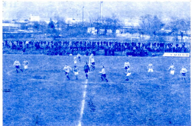
Волим и ја (ВАС) „ВЛАСИНУ“

6. Културни центар не сме више бити установа за покривање закулиских радњи око утрошка буџетских средстава, већ институција задужена за подизање културних и очување историјских вредности, уз то за уређење биоскопске сале ангажовати приватни капитал. Заинтересованим закупцима уступити на одређен временски период коришћење биоскопа, без наплате закупа, уколико би исти инвестирали у реновирање одређена средства. Забавни живот и културно забавна догађања сконцентрисати поред реке, чешће организовати културне манифестације, али и музичке концерте уз ангажовање популарних певача и група.