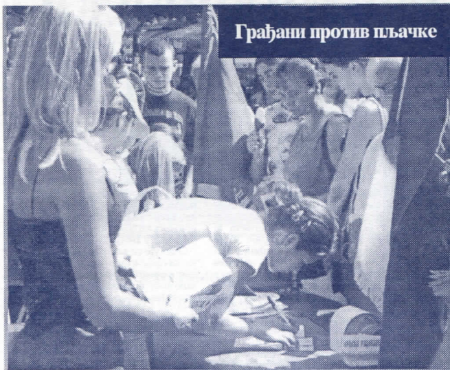
Грађани против пљачке

Да ли ће и они илалити легализацију, или ће, као и до сада, закон важити искључиво за обичан народ?