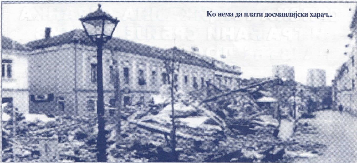
Ко нема да плати досманлијски харач...

За три године своје власти, ДОС нигде ништа није изградио. Једино у чему су били успешни јесте бесомучно рушење и уништавање народне имовине.