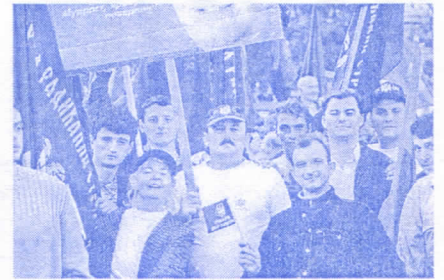
Радикали из поморавског округа на митингу СРС-а у Новом Саду на коме је присуствовало 30.000 људи

Колубари изнад услова и околности у којима се тренутно друштво налази, потпуно непримерено и неоправдано.