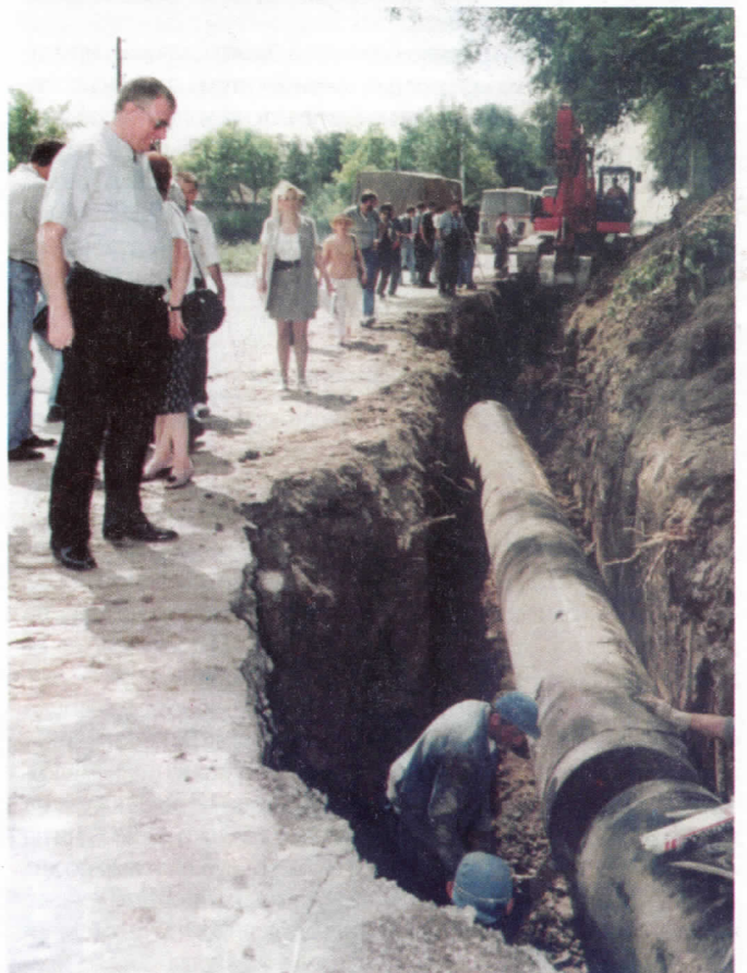
Српски радикали су изградили више од 40 километара водовода и асфалтирали још више путева кроз земунска села