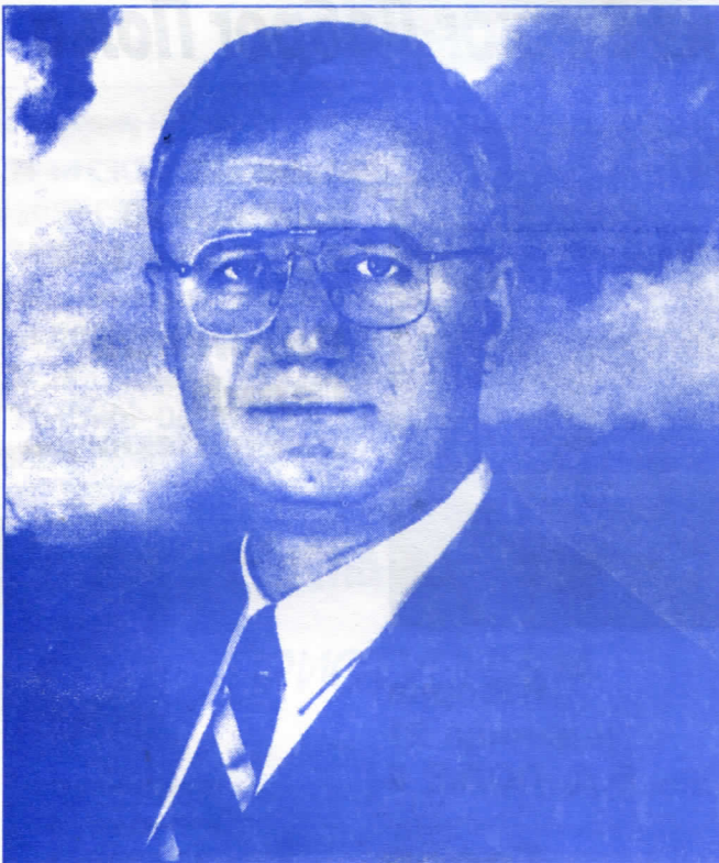
Председник Српске радикалне странке Др Војислав Шешел