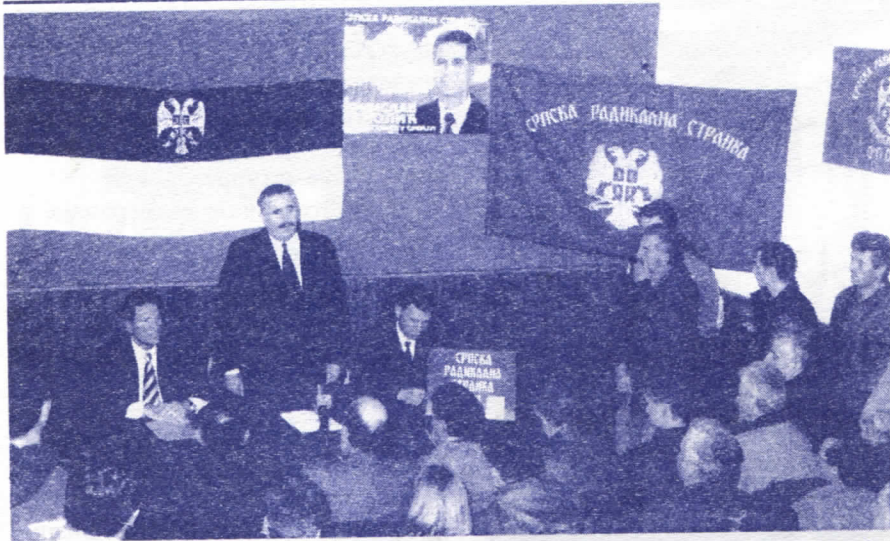
24.03.1999. г. Трибина у Опову, одмах по завршетку трибине почело је бомбардовање Југославије од стране НАТО-пакта

могућност отплате нашим пољопривредним производима током више година.