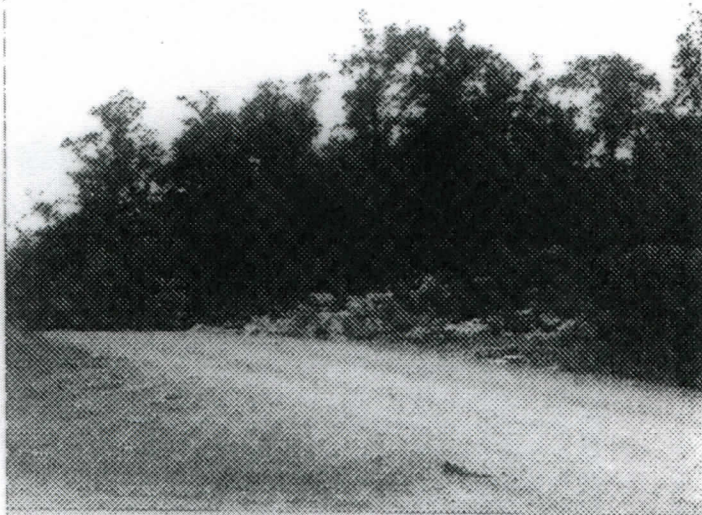
Пут Пударци-Бегалица на самом уласку у насеље припрема на оно што Вас очекује.

Стање путне мреже у Пударцима доводи у очајање. Као највећи проблем се појављује Улица Палих бораца која не одговара важећим прописима. Стога је потребно исту проширити до ширине од 4м, урадити ивичњаке и одводне канале и изградити стандардне прилазе породичним кућама. Веома велики проблем представља и улица 7.јула која се наставља на регионални пут Пударци-Бегалица. Она се такође мора проширити и асфалтирати целом својом дужином. Улица Вука Караџића, од