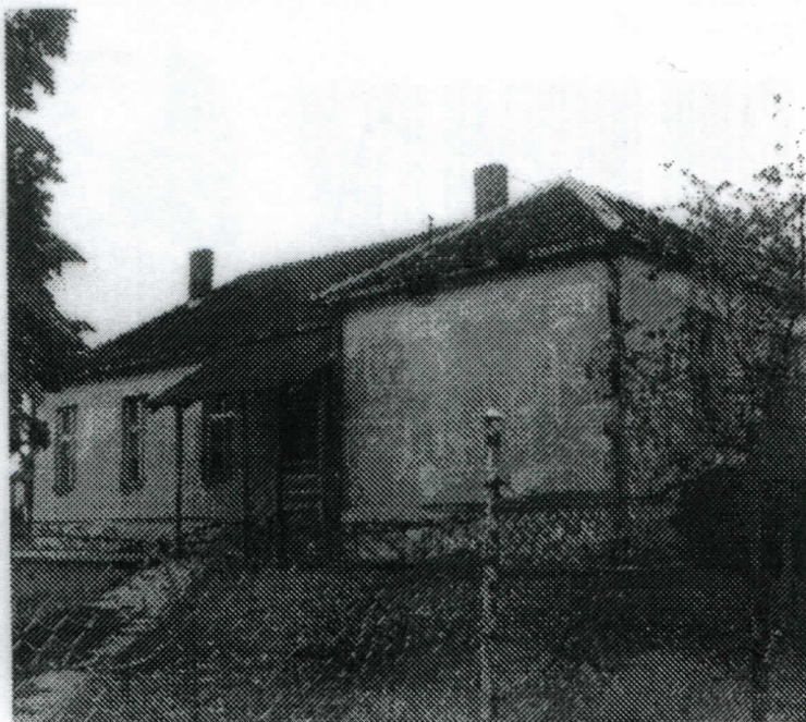
како би били проходни током целе године. Веровали или не ово није слика далеке прошлости - ово је школа у Камендолуна уласку у 21. век

читавом овом крају не би представљао свакодневну претњу. У улици 21. августа потребно је искрпити постојеће рупе, а местимично комплетна оштећења санирати и на истима урадити нов асфалтни слој. Крањску улицу такође треба асфалтирати, као и улице Гробљанску и 7.јула. Пут који се наставља на 7.јула и спаја је са магистралним путем Пударци-Брестовик потребно је санирати, насути новим слојем туцаника и изваљати га. Тако припремљеним путем би могла ићи и аутобуска линија која пролази кроз Брестовик, па да настави кроз 21.августа. У Првомајској улици има доста оштећења која се морају санирати, постојеће одводне канале неопходно је прочистити, а где их нема, изградити. Све путеве који се одавде рачвају треба проширити, извести прописна укључења у Првомајску, а затим асфалтирати. Овакве радове морамо извршити и у Камендолској, Вучјерупској и Голубовој улици. Уз то је неопходно извести и одводне канале и испусте. Све сеоске путеве треба прекрити тврдом подлогом