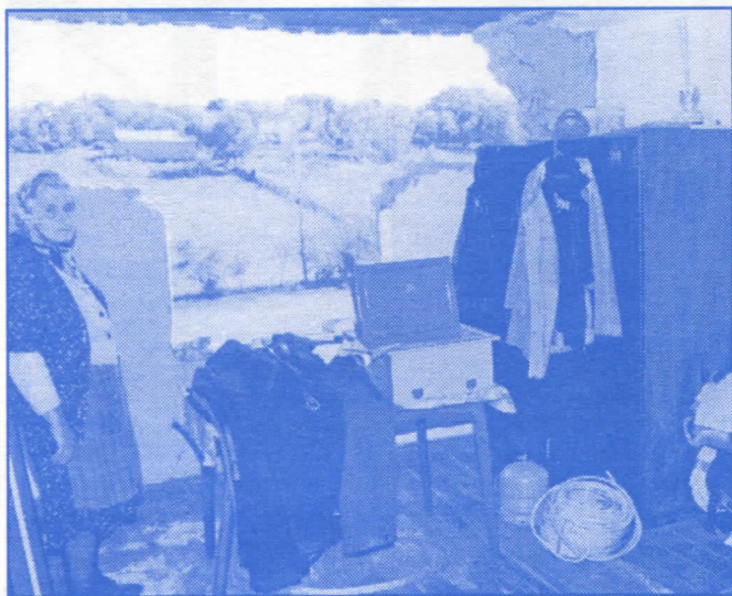
Препуштени сами себи, можда локална власт сматра да то „тако треба“