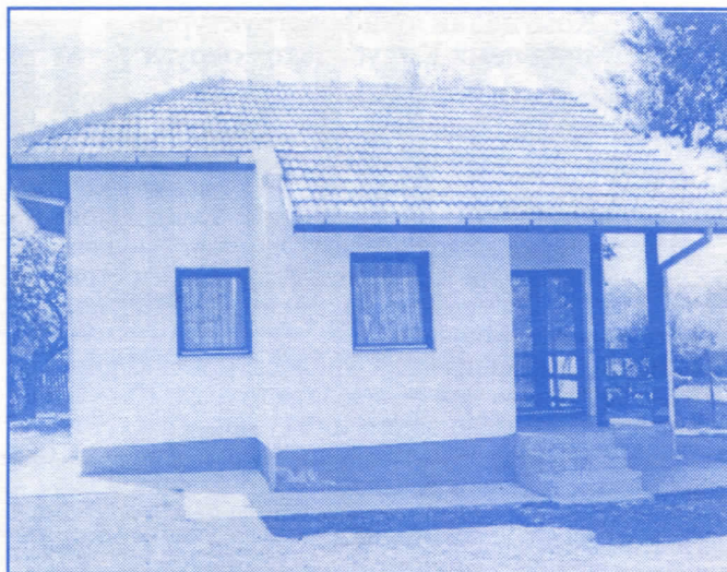
Куће за 21. век: шта је тужније, рушевине старих кућа или будућност у оваквим новим

Следеће године, старица је отишла у Општину и подсетила надлежне да је претходне године добила решење за рушење куће и зидање нове. Од запослених је добила одговор, како више није у „приоритету” и још су је посаветовали, да је најбоље да оде у подстанаре.