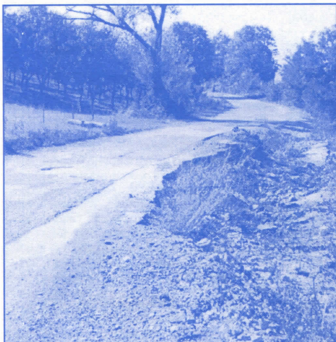
Да ли локални властодршци пролазе овим путем, да ли их је срамота?

Мислили су грађани да и бетонски носачи, који већ две године леже на путу поред главне аутобуске станице, чекају изборе. Међутим, овакве дилеме мештана, разрешило је руководство Општине Мионица. Наиме, неко од надлежних из Општине, послао је абер, онако необавезно, успут, да ће искривљени и трули дрвени носачи бити замењени новим, само ако житељи Мионице опет буду гласали за постојећу левичарску власт. Као да српском народу није доста левака, макар оних политички, левооријентисаних.