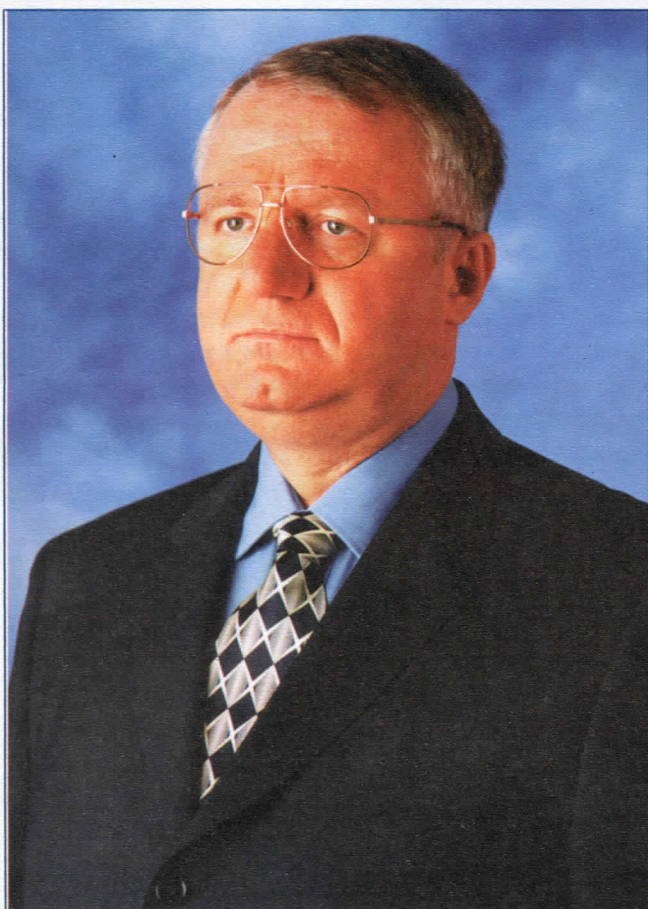
Председник Српске радикалне странке Др Војислав Шешељ