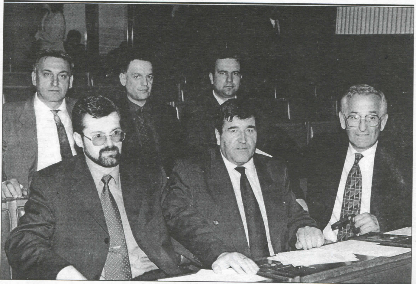
Посланици Јужно-бачког округа у Народној скупштини Републике Србије - гаранција остваривања програма Српске радикалне странке и очувања националног интереса Српског народа