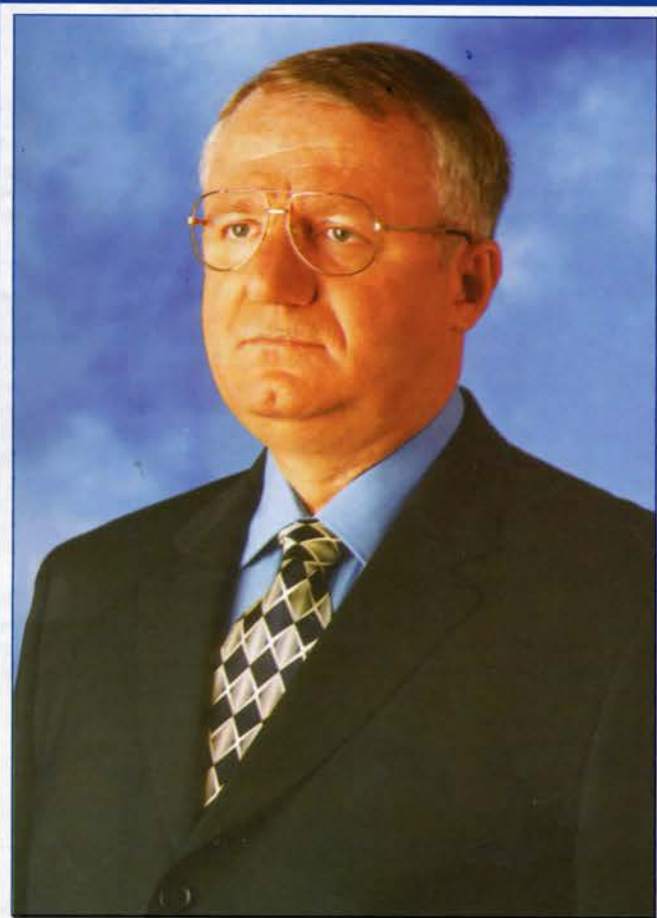
Председник Српске радикалне странке Др Војислав Шешељ