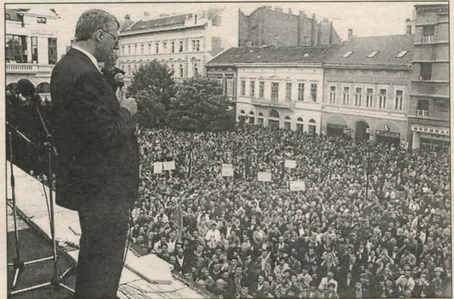
Нема отцепљења Војводине: Нови Сад је одувек упориште Српске радикалне странке

За Коштуницу, они који су га предложили, воле да кажу да је доследан политичар, патриота и националиста.