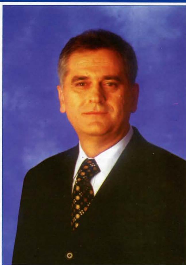
Заменик председника Српске радикалне странке Томислав Николић Кандидат за председника СР Југославије

24. септембра и 8. октобра изађите на изборе и гласајте за Српску радикалну странку