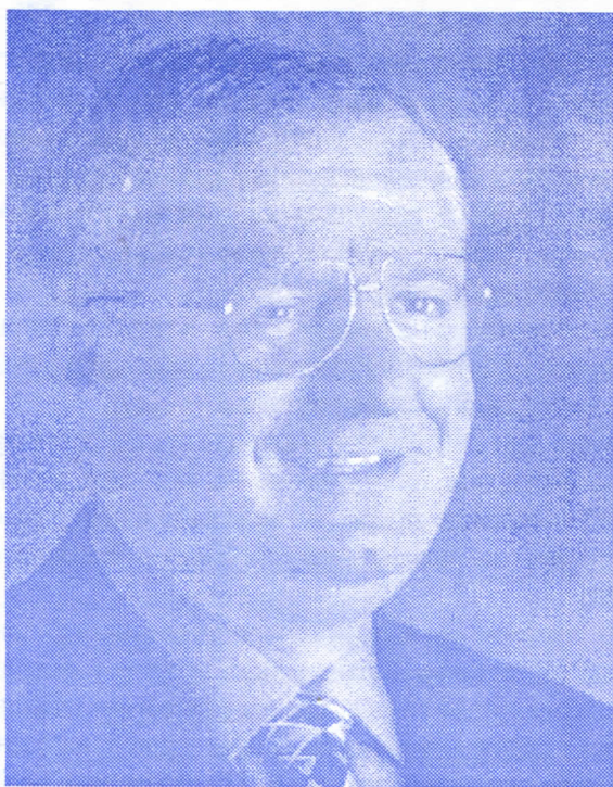
Председник Српске радикалне странке др Војислав Шешељ