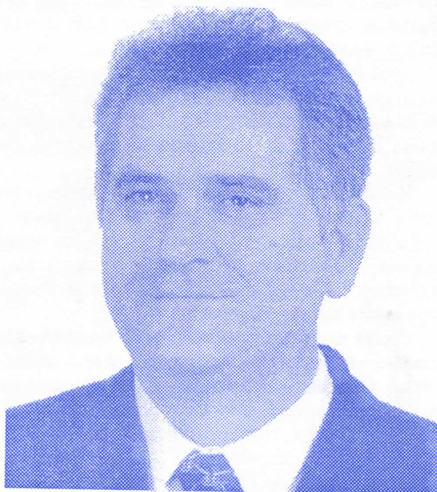
Заменик председника Српске радикалне странке Томислав Николић Кандидат за председника СР Југославије

24. септембра изађите на изборе и гласајте за Српску радикалну странку