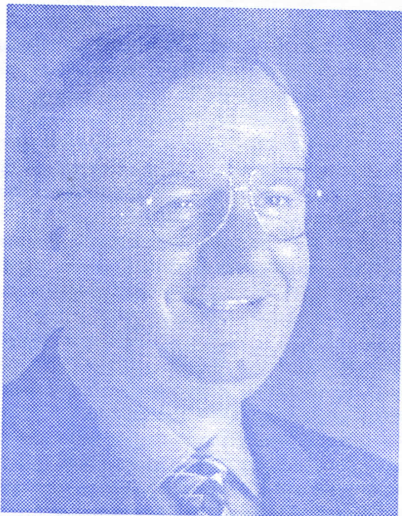
Председник Српске радикалне странке др Војислав Шешељ