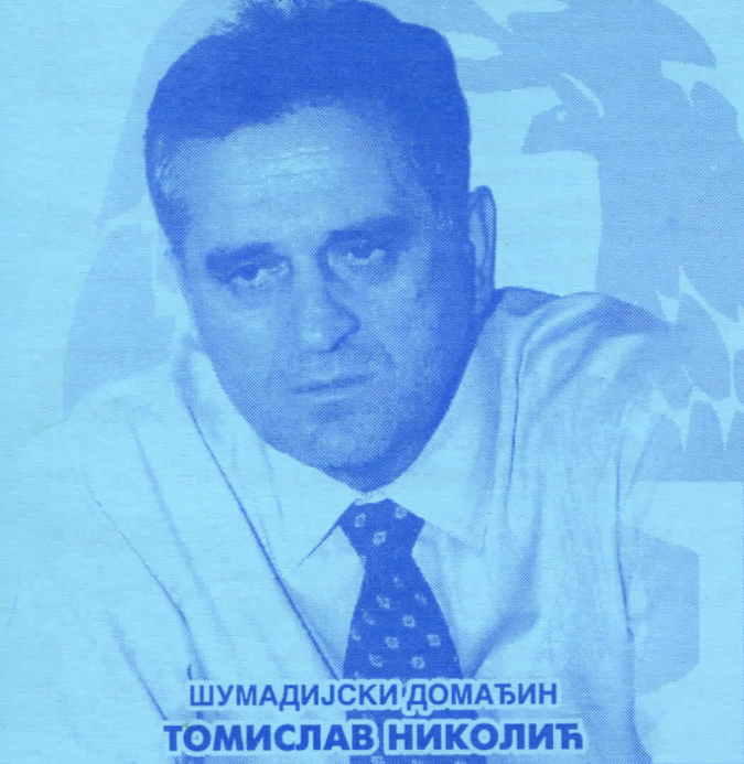
ШУМАДИЈСКИ ДОМАЋИН ТОМИСЛАВ НИКОЛИЋ

ПРЕДСЕДНИЧКИ КАНДИДАТ СРПСКЕ РАДИКАЛНЕ СТРАНКЕ