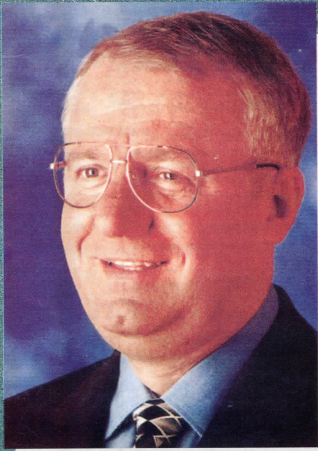
др ВОЈИСЛАВ ШЕШЕЉ ПРЕДСЕДНИК СРПСКЕ РАДИКАЛНЕ СТРАНКЕ