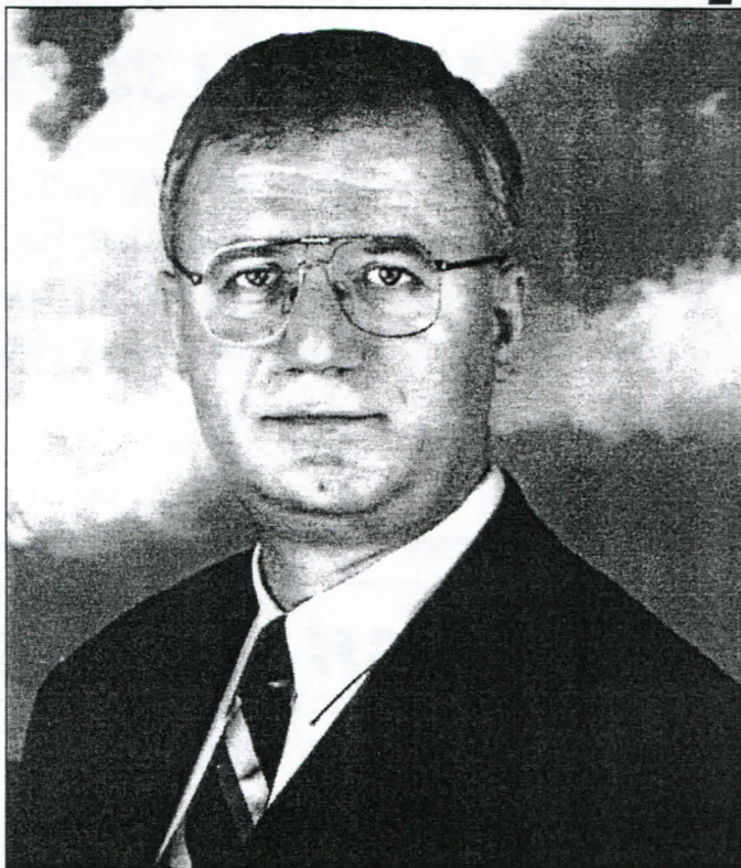
Председник Српске радикалне странке Др Војислав Шешељ

23. децембра изађите на изборе и заокружите број: