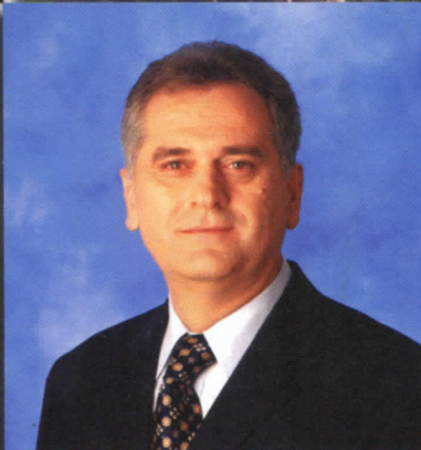
ТОМИСЛАВ НИКОЛИЋ КАНДИДАТ ЗА ПРЕДСЕДНИКА СР ЈУГОСЛАВИЈЕ