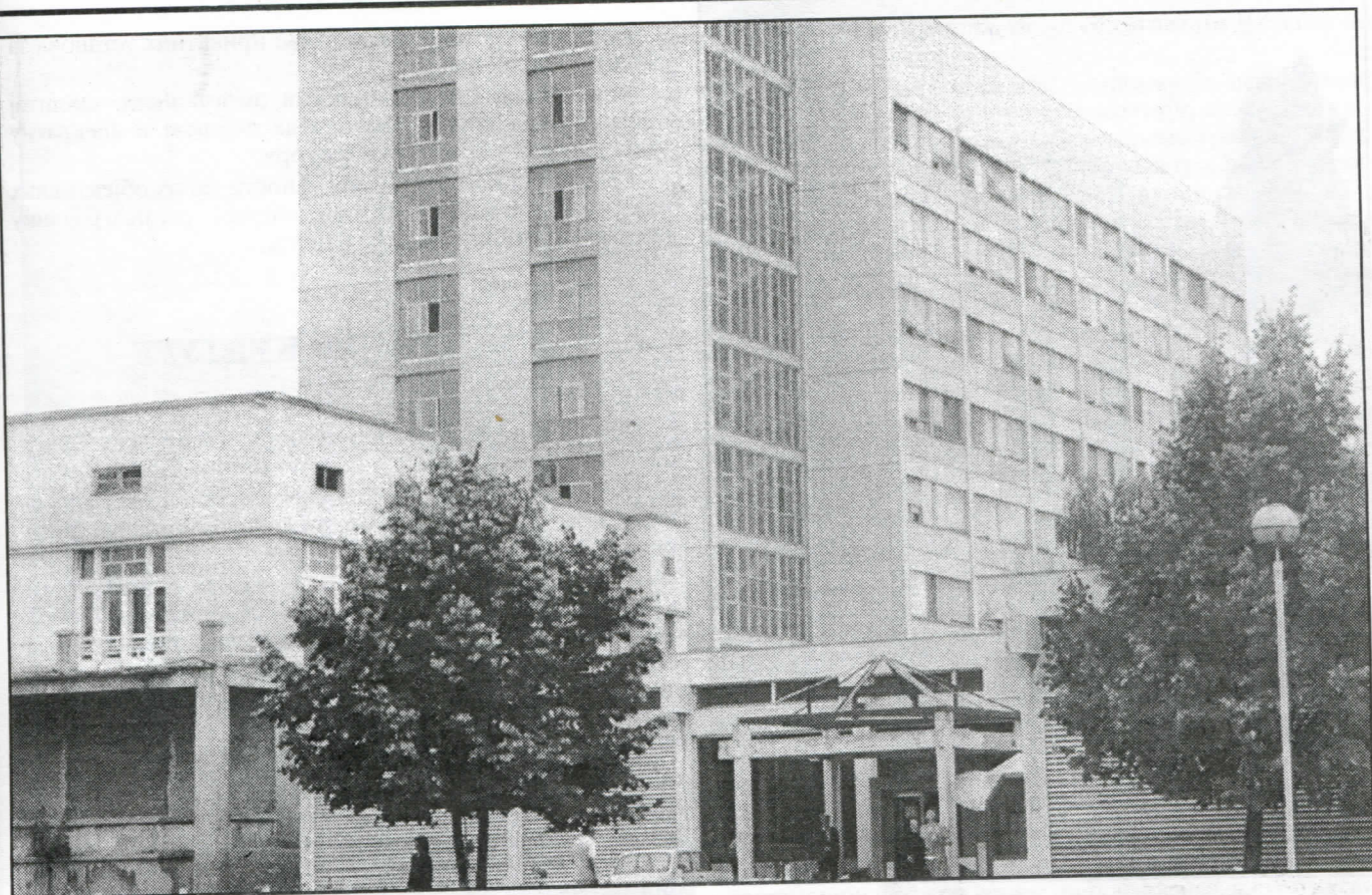
Грађани Крагујевца заслужују бољи квалитет лечења

председници Извршног одбора Скупштине града, дају сагласност на цену грејања у којој грађани који имају уграђене мераче плаћају више за грејање од оних који немају.