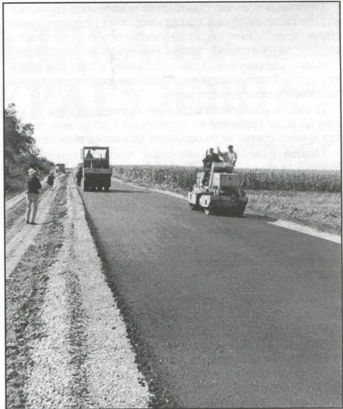
Тамо где српски радикали имају власт пут изгледа овако

Небрига ове власти, оличена у распаднутој коалицији „Заједно”, а сада СПО, огледа се на сваком кораку, тако да се грађанин који стигне тамо где се упутио, а при том не буде изгужван и изгажен, осећа као да је награђен.