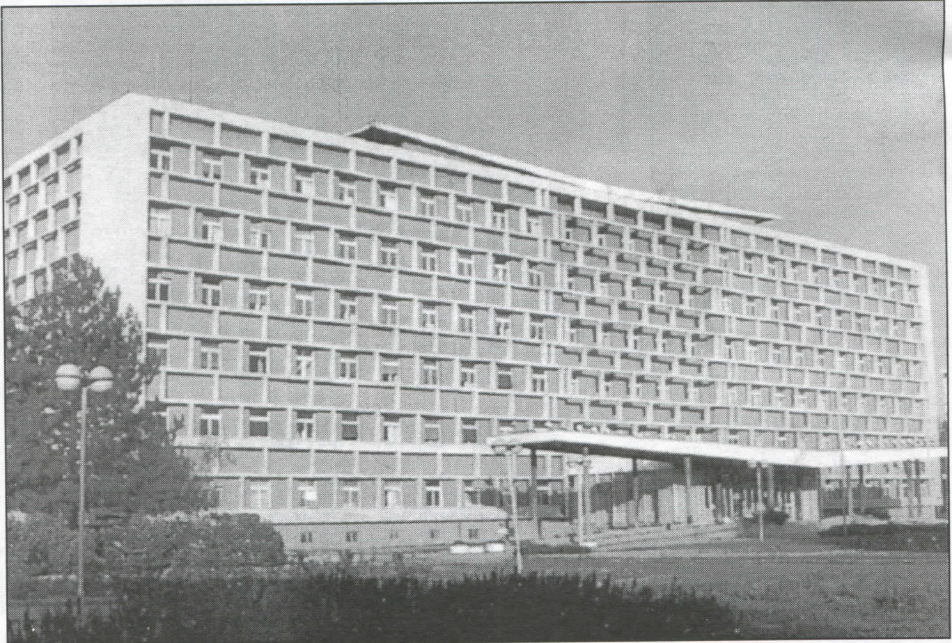
Анархија и безвлашће: зграда Скупштине града у рукама одавно распаднуте Коалиције „Заједно”

Непоштовање овог начела ствара несигурност. Типичан пример за ову тврдњу је програм а, нажалост, и освајање локалне власти у Крагујевцу сада одавно распаднуте коалиције „Заједно” која дословно каже: „преиспитаћемо новчана давања Београду, односно Републици Србији.”