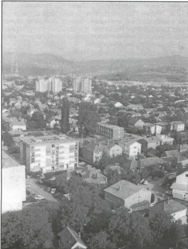
Само путем правилног и непристрасног информисања може се доћи до потпуне истине

Неискоришћене просторе, и оне који се користе у погрешне намене, претворићемо у места на којима ће се одвијати разне културне манифестације.