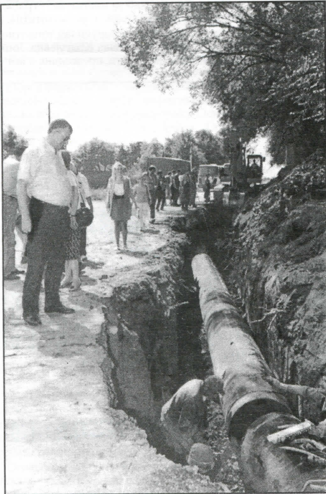
На овај начин Српска радикална странка решава проблеме водоснабдевања

Асфалтираћемо локалне путеве Пајазитово - Угљаревац (преко Шења), саставићемо М.Врбица - Добрача као и пут Светиња - В. Шењ, Корићани - В. Поље - Грошница и остале.