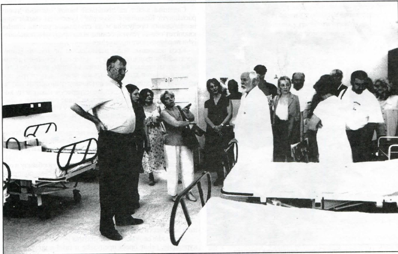
Српски радикали брину о својим грађанима

Цену ове врсте услуга одређује испоручилац топлотне енергије уз сагласност Скупштине града Крагујевца. Још увек актуелни носиоци локалне власти, председник и пот-