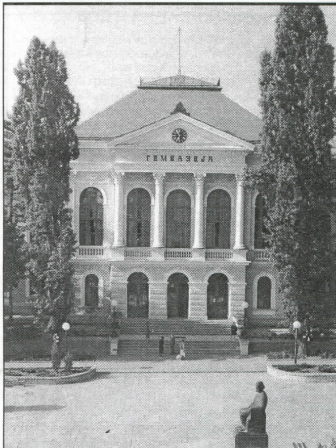
Српска радикална странка улагаће у школство и образовање

Напрасно, преко ноћи, повећају цену својих услуга за 70% и још одреде да се до десетог у месецу измири акон-тација за наредни месец.