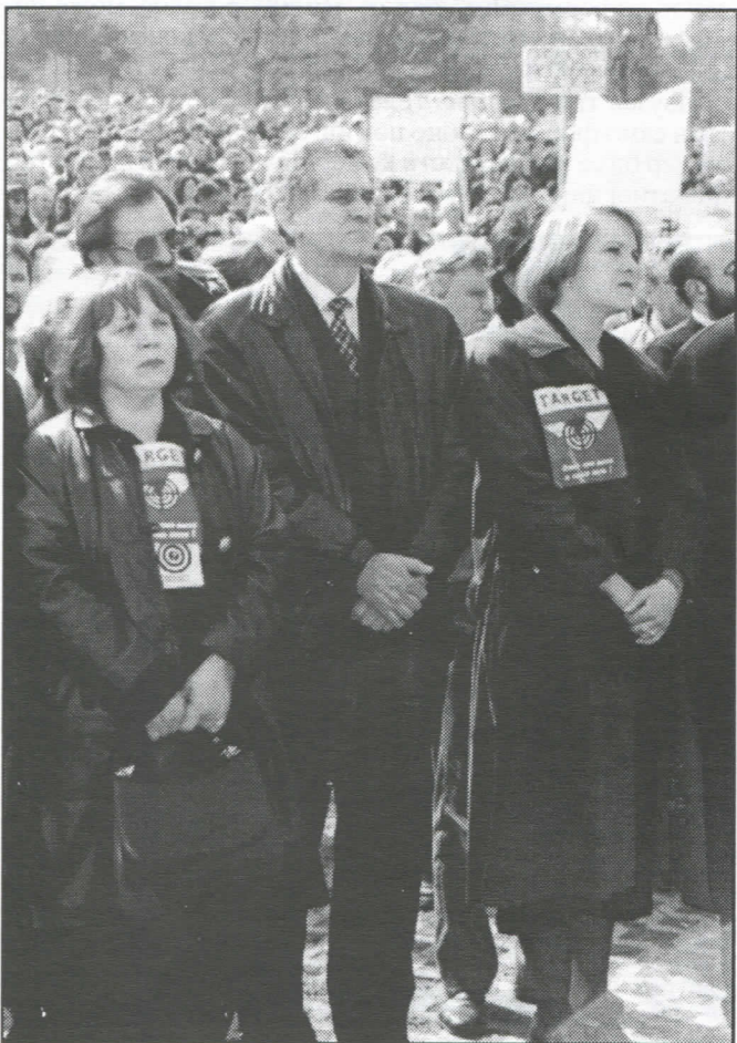
НАТО је најружнија реч на свету: на великом митингу у Крагујевцу, током агресије

Српска радикална странка инсистира на строгом поштовању законске регулативе, новом Закону о јавном ин-