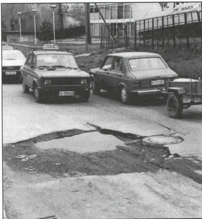
Каква власт, такви и путеви

У граду Крагујевцу постоји само једно предузеће које обавља превоз грађана у градском саобраћају.