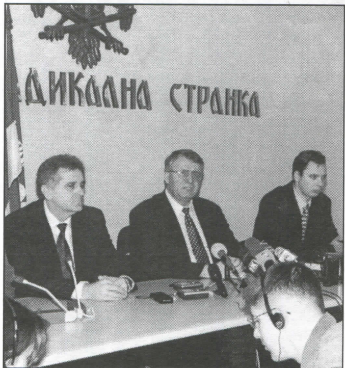
Српски радикали ће спречити све видове до сада изражене медијске манипулације у Крагујевцу

Изузев три државна телевизијска канала, од којих би један само формално био под ингеренцијом државне власти, јер би се у потпуности комерцијализовао и препустио приватној иницијативи и њеној слободној вољи, све оста-