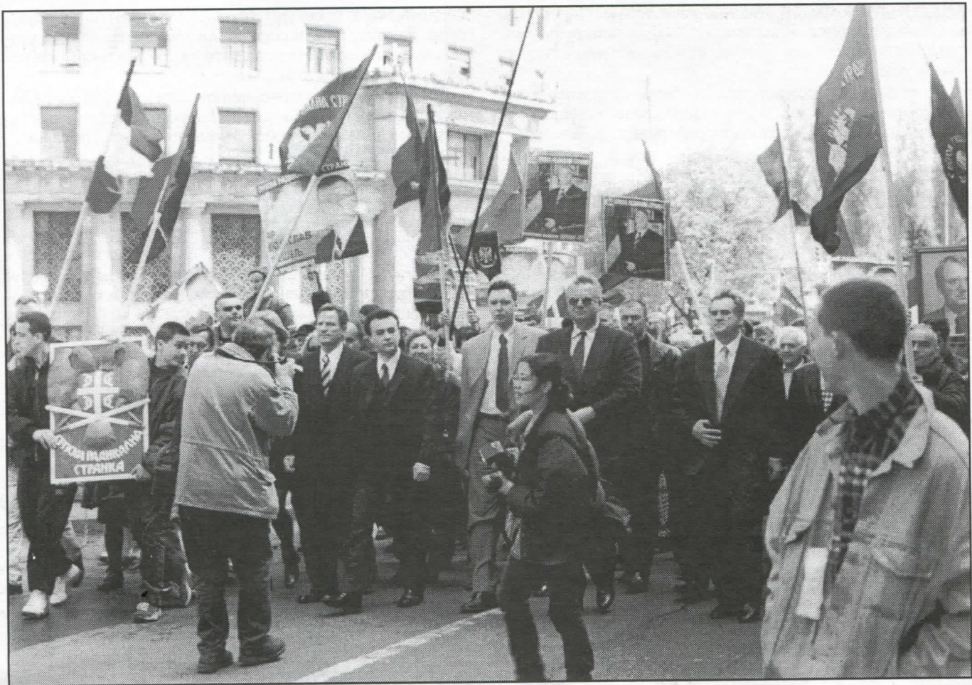
Српски радикали познати су по томе да никада нису лагали, ни обмањивали народ: они говоре народу истину и онда кад се та истина народу не допада

за санацију локалне депоније смећа, која је извор заразе и прави пример неодговорности и неспособности садашње власти,