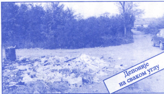
Депоније на сваком углу

Драги грађани, овим програмом желимо да вам објаснимо зашто на предстојећим изборима треба да гласате за Српску радикалну странку. Свако писмено је по природи несавршено, јер много тога не може да стане на папир. Зато, за све потребне информације обратите се: Општинском одбору Српске радикалне странке Палилула; Улица Прерадовићева 4, 11000 Београд; телефон: 764-546 и 766-889.