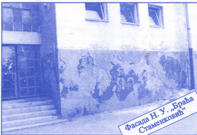
Фасада Н. У. „Браћа Стаменковић“

Организоваћемо да се послови општинске управе врше преко: Одељења за општу управу, Одељења за грађевинске и комуналне послове, Одељења за финансије, привреду, друштвене делатности и планирање, Одељења за имовинско-правне и стамбене послове, Службе за скупштинске и заједничке послове и Службе за информисање.