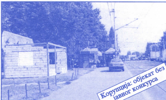
Корупција: објекат без јавног конкурса

Грађевинско земљиште које је у општинској својини, понудићемо на лицитацију и под једнаким условима омогућићемо учешће физичким и правним лицима.