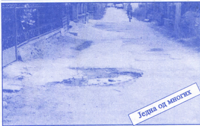
Једна од многих

Подржаваћемо донаторство и спонзорство као вид помагања културним установама. Покренућемо отварање нових огранака библиотека и обезбедити простор за њих (евентуално просторије месних заједница). Обновићемо домове културе у свим приградским насељима.