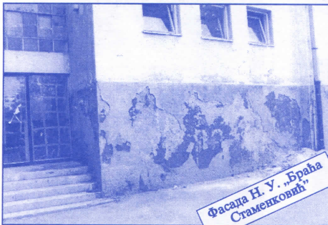
Фасада Н. У. „Браћа Стаменковић“

Грађевинско земљиште које је у општинској својини, понудићемо на лицитацију и под једнаким условима омогућићемо учешће физичким и правним лицима.