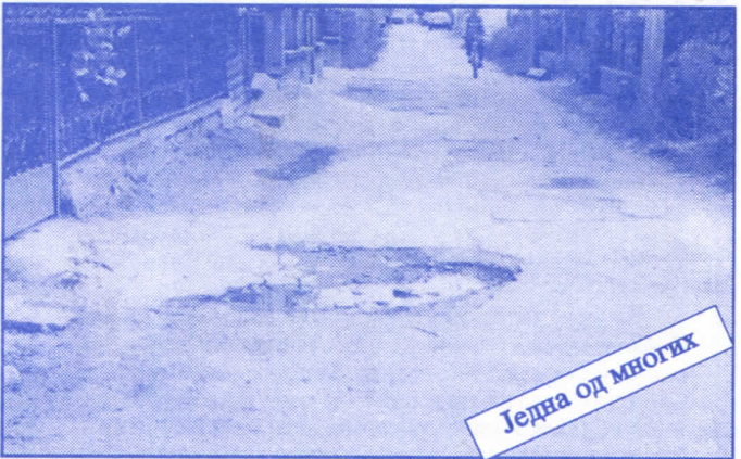
Једна од многих

Општинском одбору Српске радикалне странке Палилула; Улица Прерадовићева 4, 11000 Београд; телефон: 764-546 и 766-889.