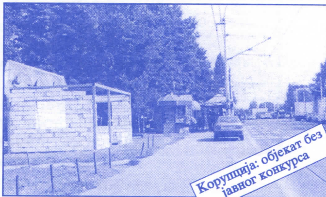
Корупција: објекат без јавног конкурса

Општина ће помоћи социјално најугроженије становнике Палилуле. Та помоћ ће имати једнократни карактер. Примат у оваквим акцијама имаће деца без родитеља, деца палих бораца, инвалиди последњег рата, стари грађани и физички хендикепирана лица. Организовање овакве помоћи биће обавњено путем конкурса објављеног у општинским новинама (или другим средствима јавног информисања) на који ће моћи да се пријаве сви грађани општине Палилуле.