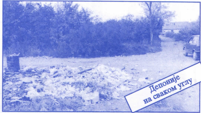
Депоније на сваком углу

Заложите се за пројектовање и изградњу канализације за кишне и отпадне воде у сеоским насељима, очистићемо колекторе, умањимо опасност од бујица и активирања клизишта. У градском делу Палилуле решићемо проблем атмосферских долаја које при изградњи новијих објеката нису канализане те у време киша угрожавају сутерене и подруме околних зграда.